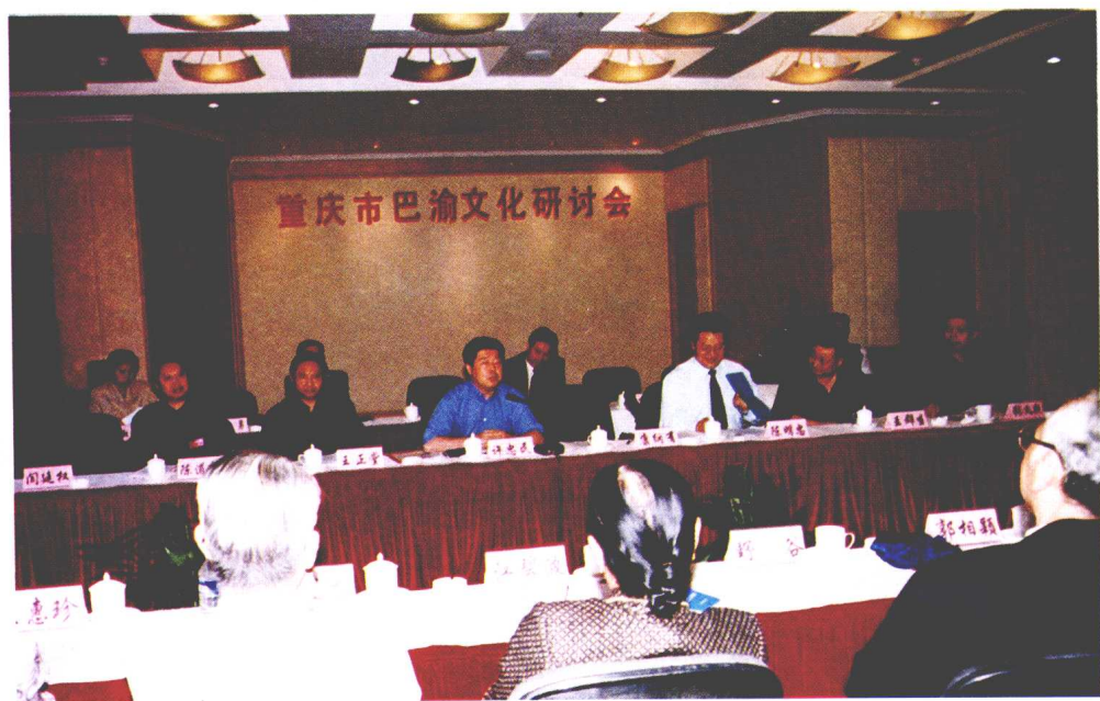
重庆市副市长许忠民会上讲话。

10月17日—10月18日由重庆忠县人民政府、重庆市文史研究馆联合主办的“重庆市巴渝文化研讨会”在忠县隆重开幕。市人大副主任康绍有（左三）、副市长许忠民（左二）、忠县县长陈明忠（右三）、副县长张义敬（右一），重庆市文史研究馆副馆长王群生（右二）、林达开出席了会议。