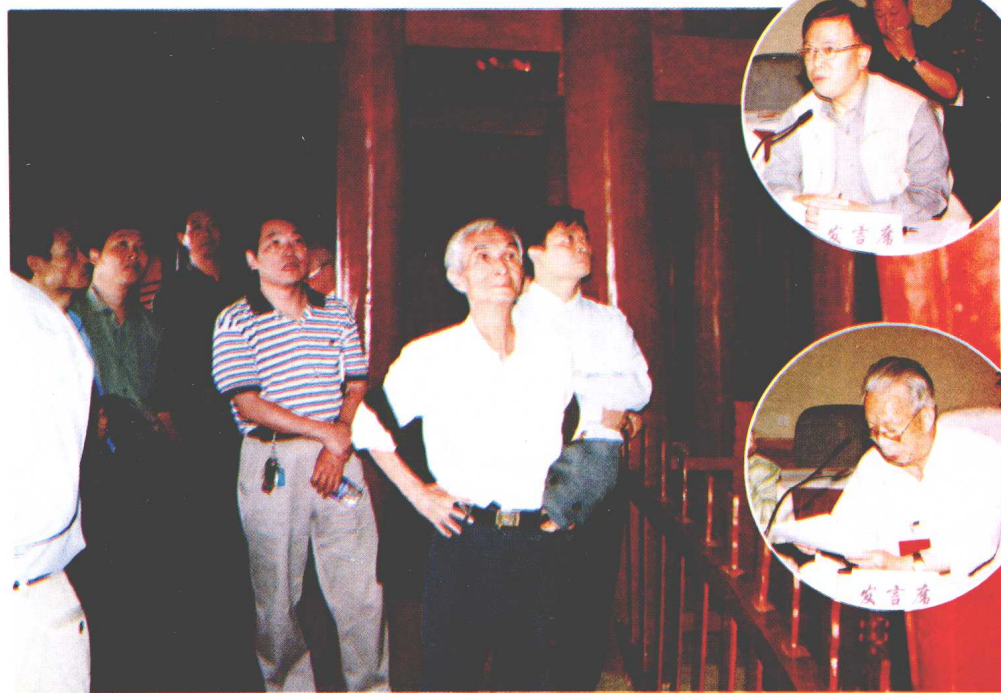
市文史馆员参观忠县石宝寨。