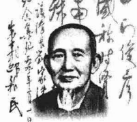
纂史濬對劉家洙公