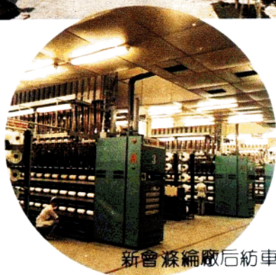
新會滌綸廠后紡車間