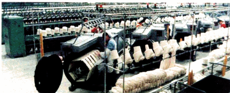
新會毛紡廠生產車間