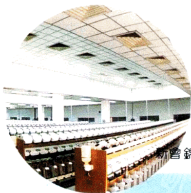
新會錦綸廠后紡車間