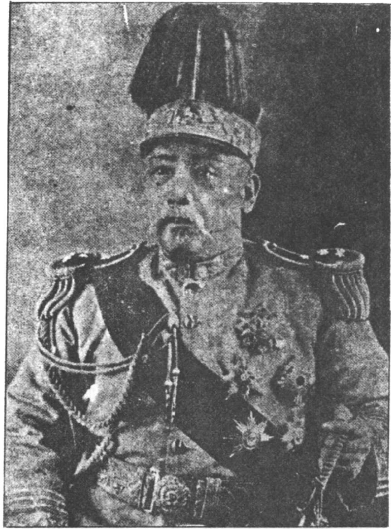
中華民國總統袁世凱，和揭發袁世凱禍國的史料。