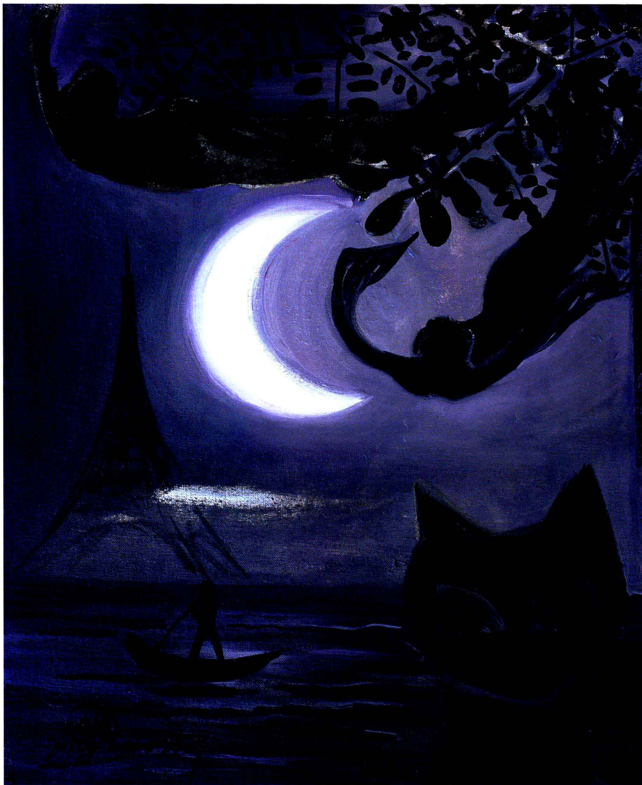
月明 38 × 46cm 2009 布面油画