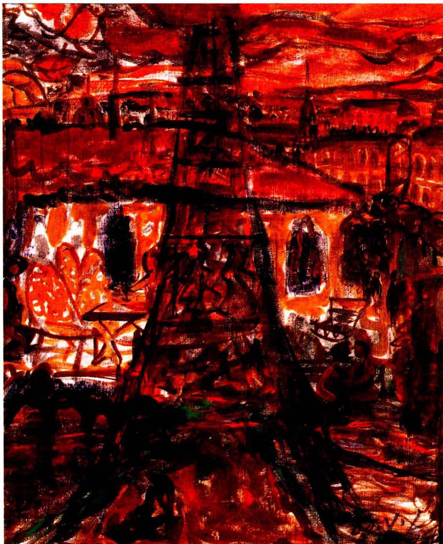
塞纳河系列 50 × 60cm 2002 布面油画

心世界。画面多是忧伤而孤独的身影，徜徉在自己情丝绵绵的经历中，画面上的月亮在天上，也在水里，天上是希望，水中是幻影。