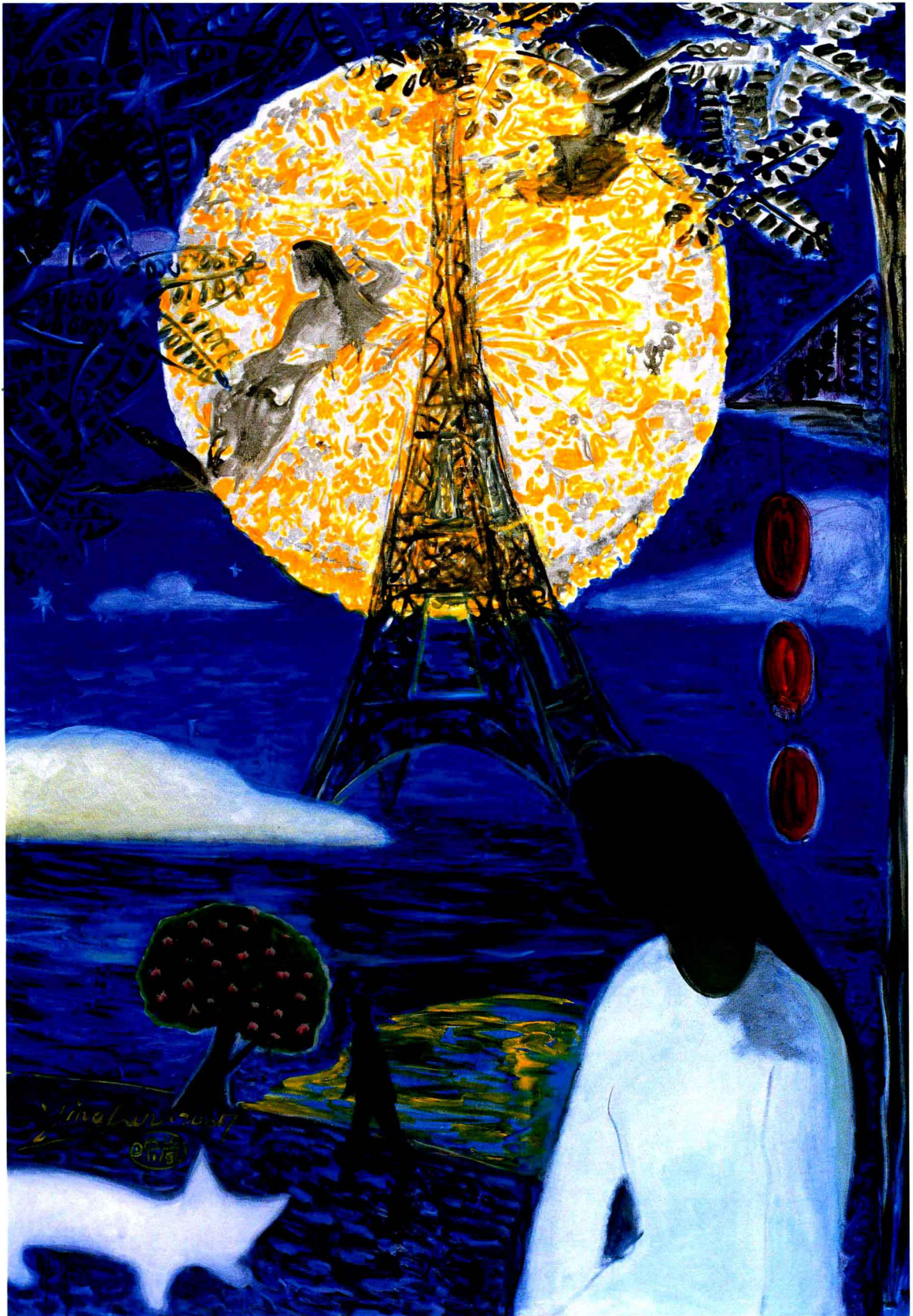
月圆时分之二 130 × 190cm 2007 布面油画