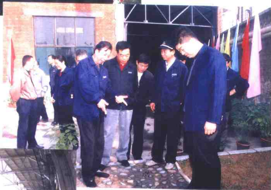
▼ 大库转向架检修场地