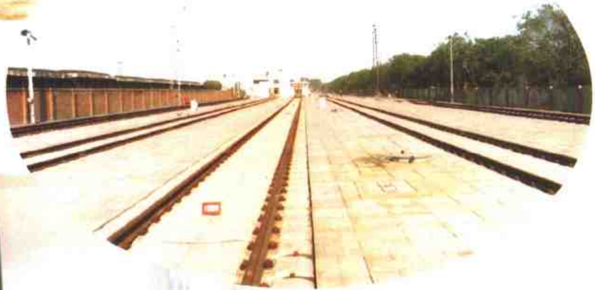
▲ 客车整备线和停留线