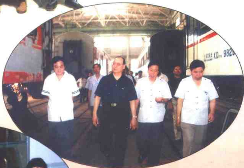
▶ 郎局长(左二)检查客车检修情况