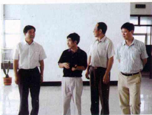
· 国家图书馆馆长詹福瑞