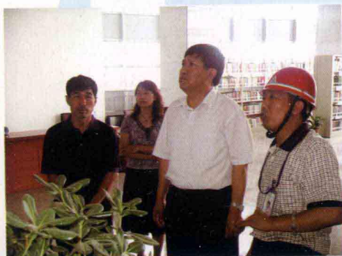
· 市委副书记、市长菅瑞亭