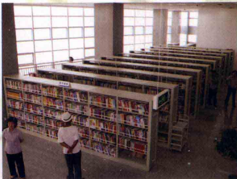
· 自然科学图书借阅室