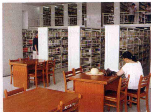
· 社会科学图书借阅室