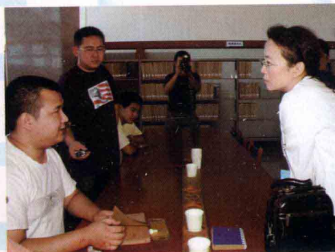
· 市委常委、宣传部长时晓峰