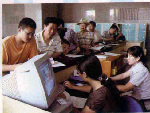
· 读者正在办理新读者证