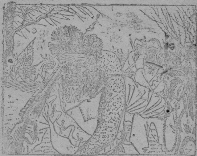
六句鄉長親率民衆參加抗戰