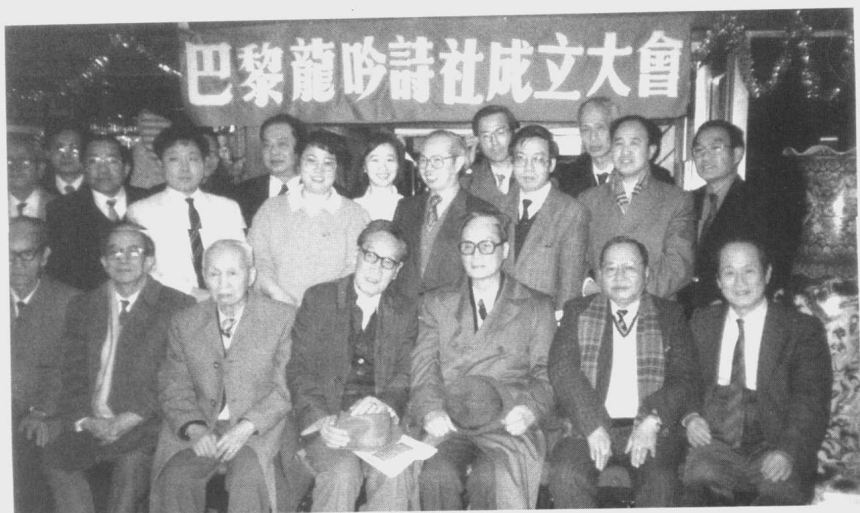
一九九零年一月，“巴黎龍吟詩社”成立。