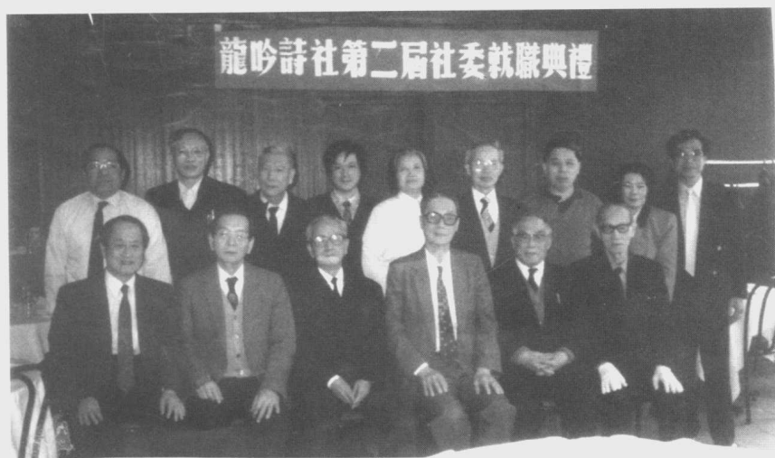
九二年，龍吟詩社第二屆社委就職典禮。