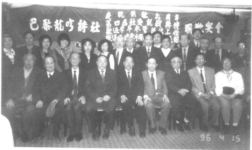
九六年，龍吟詩社第四屆社委就職典禮。