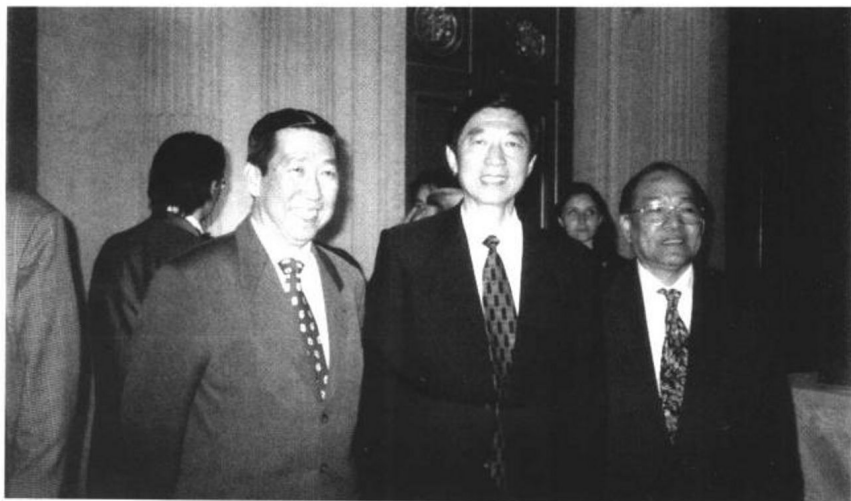
吳建民大使與本社立案社長何福基（左一）和社長陳滸合影留念，并愉快地為“龍吟詩詞選集”（第三輯）題辭嘉勉。