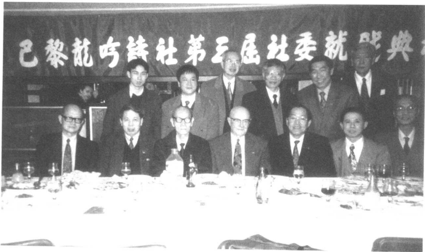
九四年，龍吟詩社第三屆社委就職典禮。