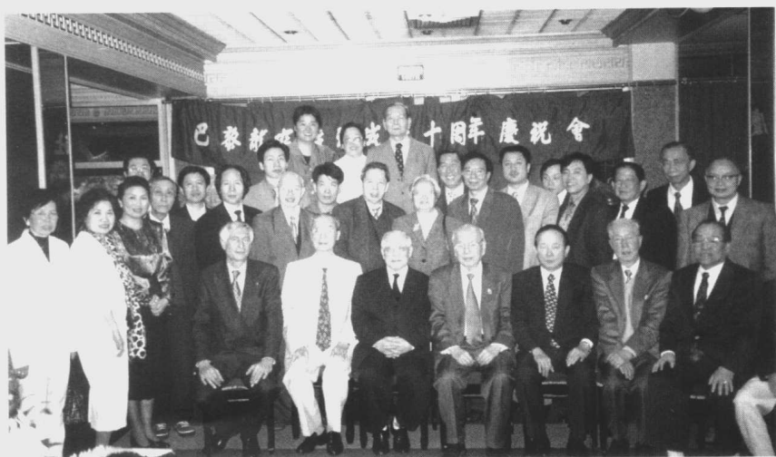
紀念本社成立十周年慶祝會上合影。