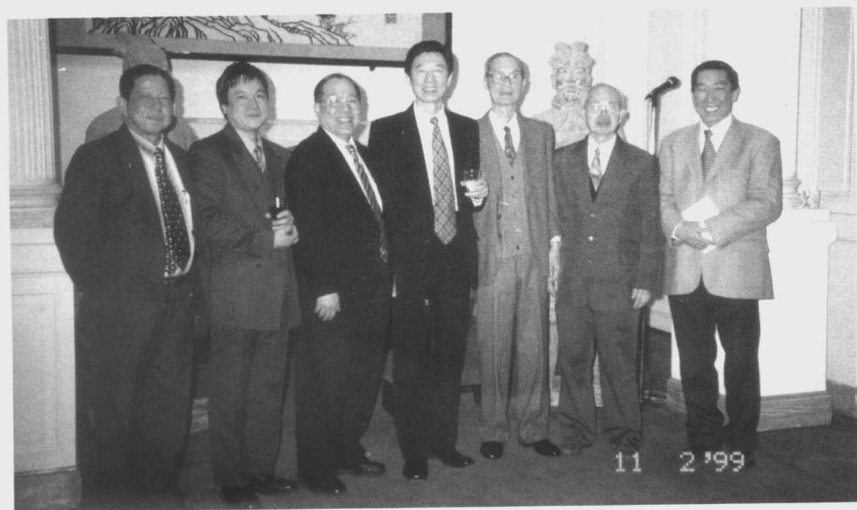
九九年春節招待會上，新任中國駐法特命全權大使吳建民先生接見本社代表。左起：郭錫麟、葉星球、陳泚、吳大使、羅郁生、劉錦權、何福基。