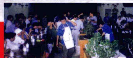
中外盆景艺术家联谊会示范表演现场