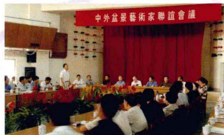
中外盆景艺术家联谊会