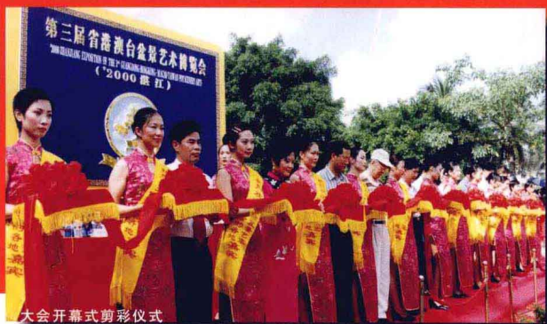
大会开幕式剪彩仪式

经湛江市人民政府批准，由湛江市人民政府、广东省盆景协会、湛江市盆景协会联合主办的第三届省(粤)港、澳、台盆景艺术(2000湛江)博览会在我市举办。