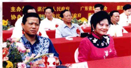
贵宾在大会主席台上