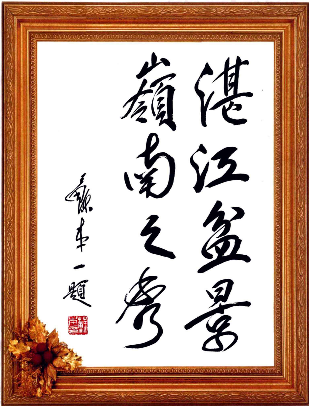
苏本一先生现任中国盆景艺术家协会常务会长、中国花卉盆景杂志社社长兼总编