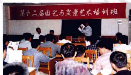
第十二届园艺与盆景艺术培训班