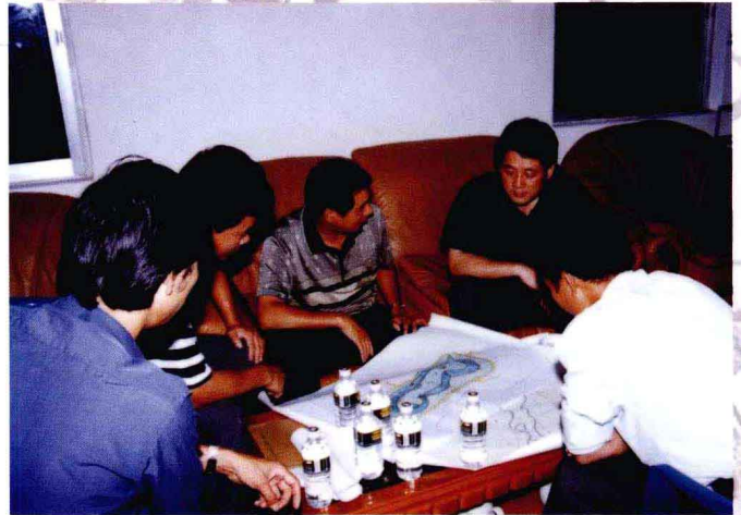
湛江市副市长阮日生(右二)2000年6月到寸金桥公园听取博览会中心展场改建方案汇报