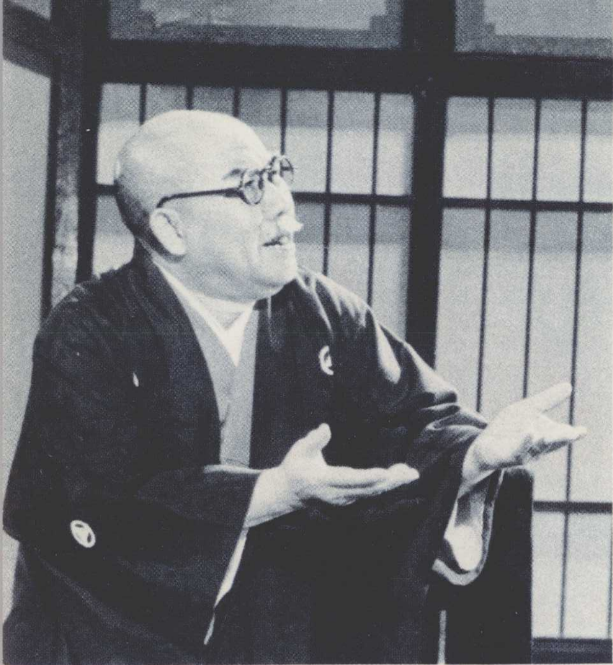
鸠山——日寇宪兵队队长。