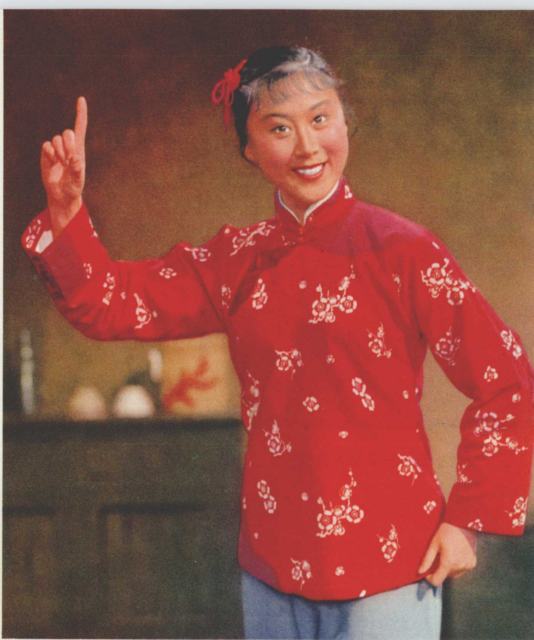
铁梅——李玉和的女儿。