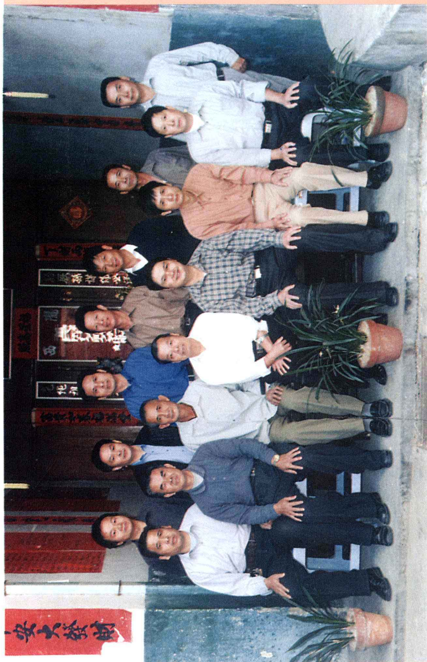
连城董氏首次修谱常务理事