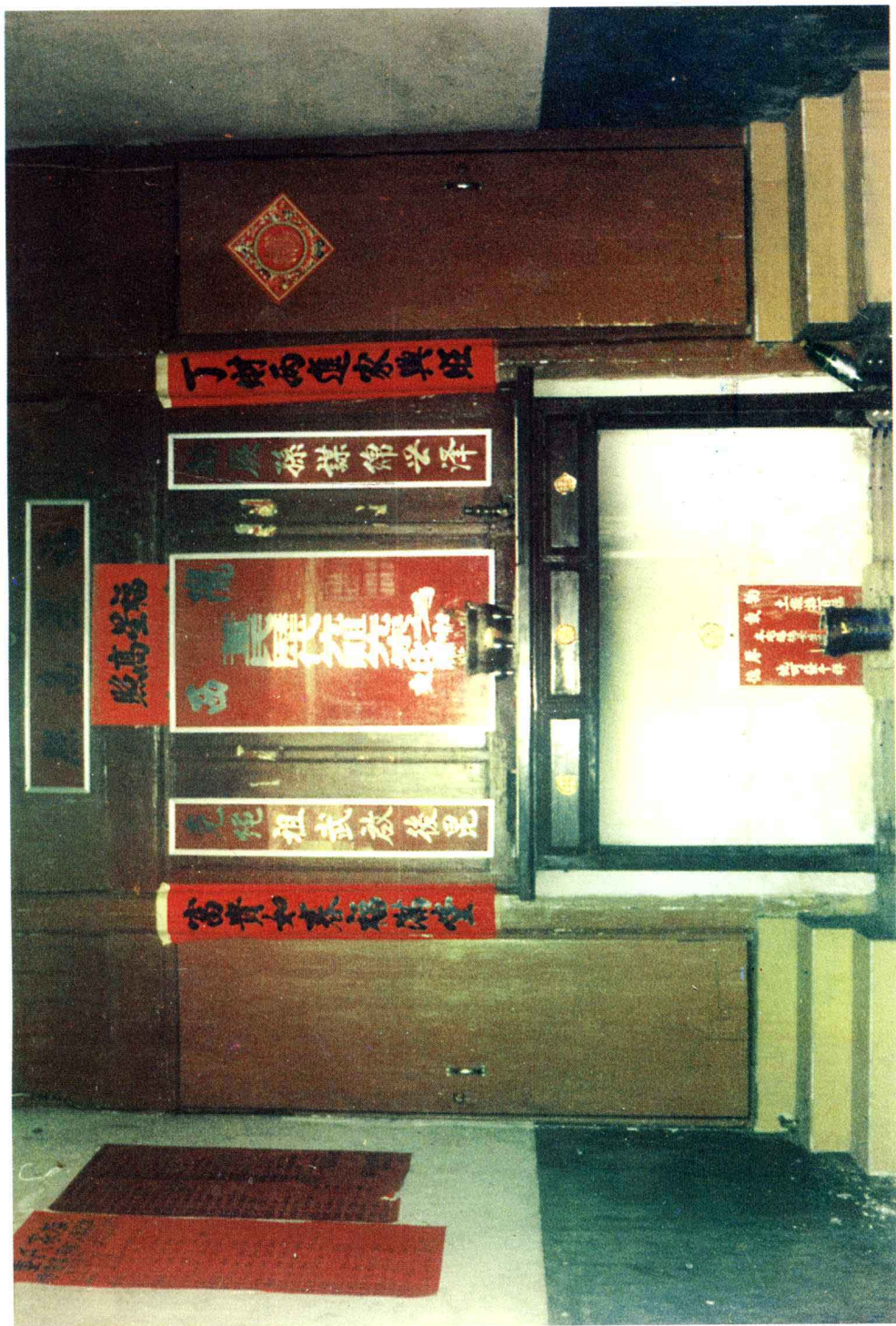
连城董氏大桥下家吉公老祖厅