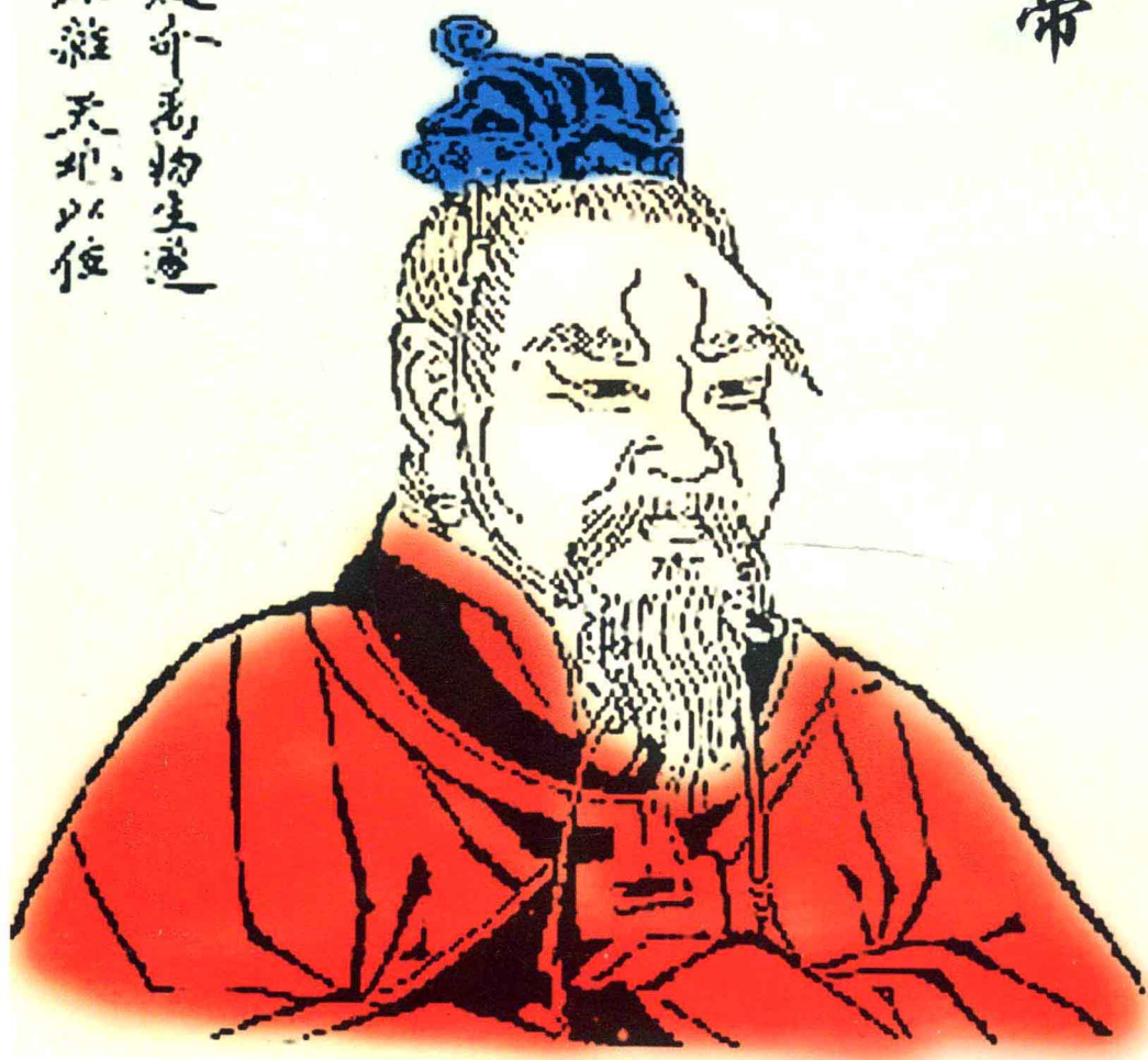
顓 頊 帝