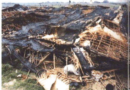
▲ 杏林区农业受灾严重,农民搭建的食用菌培育棚被台风夷为平地。