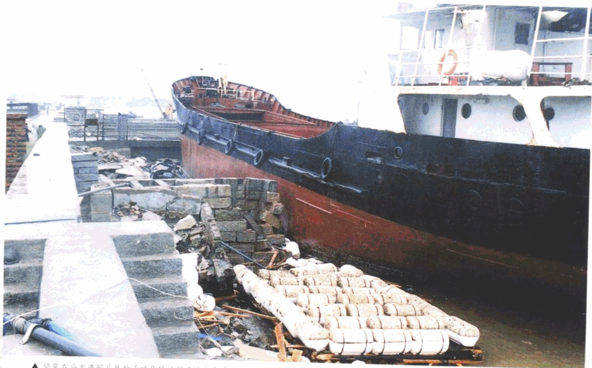
▲ 停靠在马寮湾码头外的千吨货轮被风浪冲上岸边，船体受损。