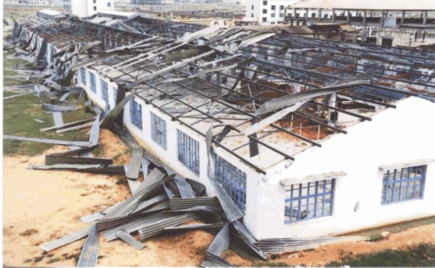
◀ 海沧新阳工业区一些厂房的屋顶被台风吹掉。