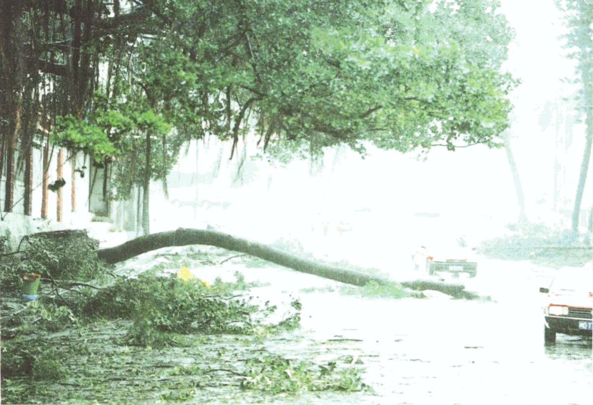
▼ 虎园路三岔路口被倒一大片。