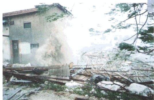
◀ 杏林湾畔一些房屋在大浪冲击下难以幸存。