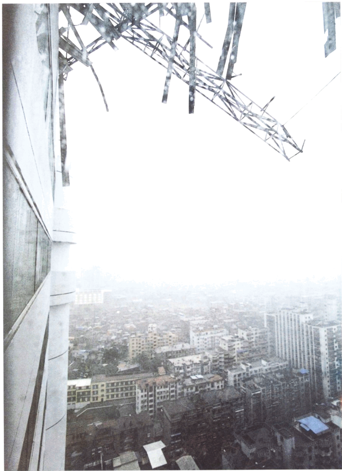
▶ 九日上午八时许，从宏都大酒店三十四层楼上看，风狂雨骤，市区一片茫茫。