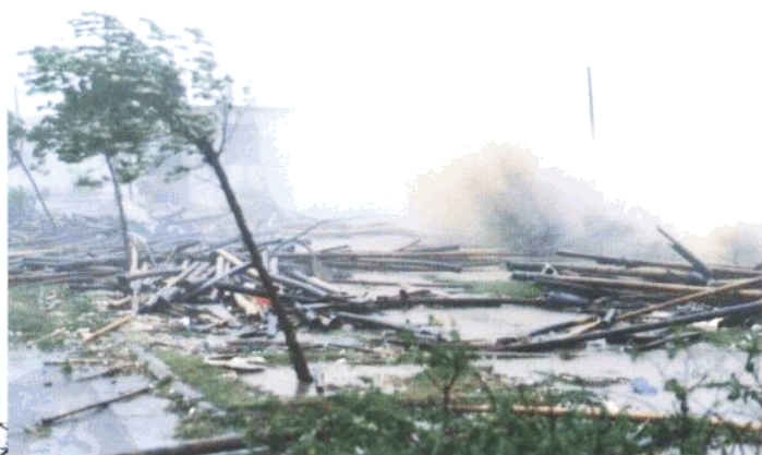
▲ 滨海的杏林杏溪路，满地是被海浪冲上来的竹杆。