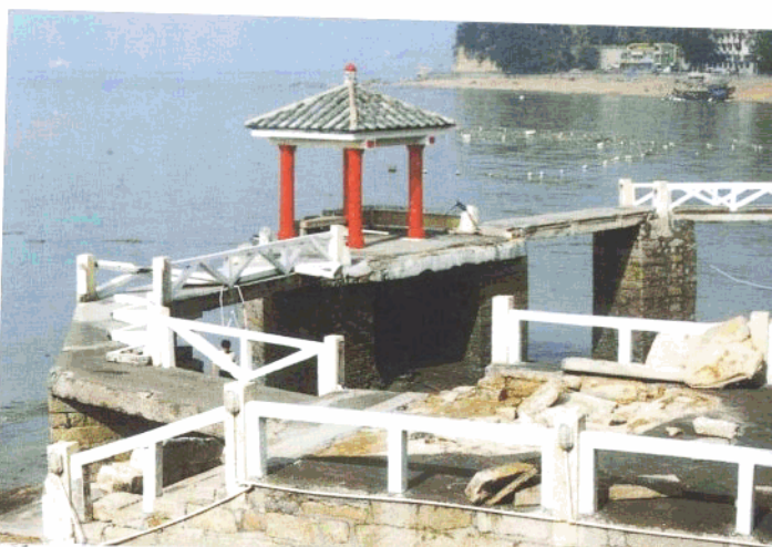
▲ 台风中，鼓浪屿菽庄花园四十四桥受损断裂为4截，“千波亭”2号桥墩出现贯穿性开裂，园内花木受损严重。