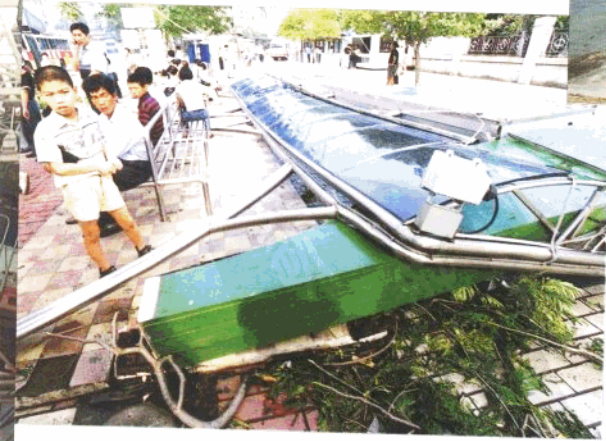
◀ 中山公园南门公交候车亭顶棚的不锈钢支柱也不顶住台风。