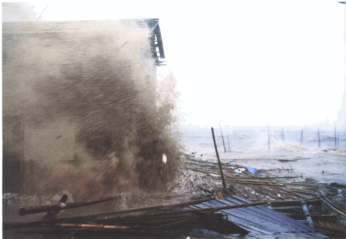
▲9日正值天文大潮，上午10时许，数米高的巨浪打在海边的建筑物上。