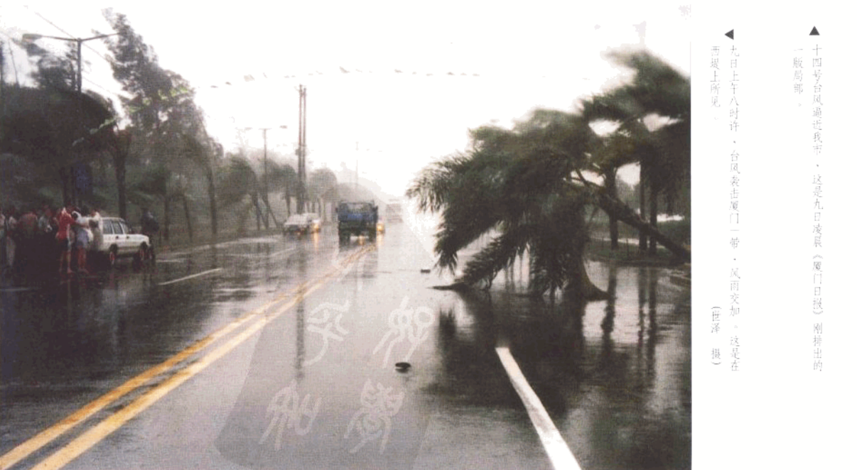
▲十四号台风逼近我市,这是九日凌晨(厦门日报)刚排出的版局部。 ▲九日上午八时许,台风袭击厦门一带,风雨交加,这是在西堤上所见。

受今年第14号台风影响,厦鼓轮渡航行至10月9日凌晨00:30停航,何时复航视台风情况在码头另行通知。请乘客互相转告。 厦门市轮渡公司 1999年10月8日