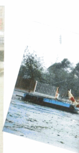
◀ 中午, 厦门大学西校门的门口水涨过膝。