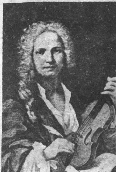
維瓦第 (A. Vivaldi, 1675-1741)