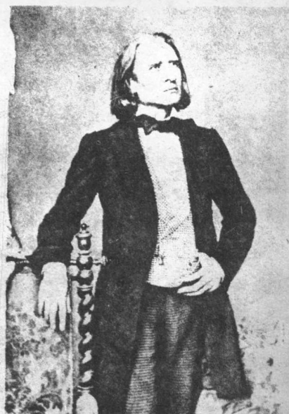
李斯特(F. Liszt, 1811-1886)