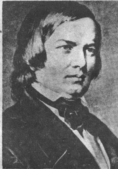
舒曼(R. A. Schumann, 1810-1856)