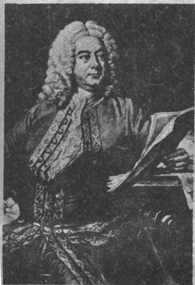
韓德爾 (G. F. Händel, 1685-1759)