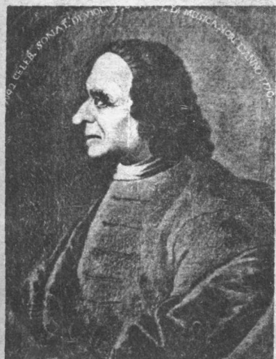
塔蒂尼 (G. Tartini, 1692-1770)