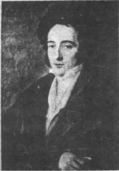
孟德爾遜(F. B. Mendelssohn 1809-1847)