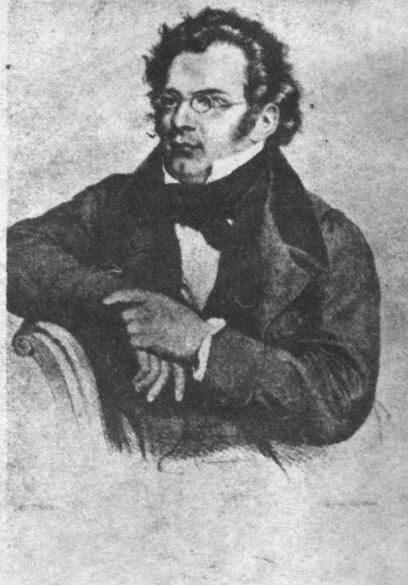
舒伯特(F. P. Schubert, 1797-1828)