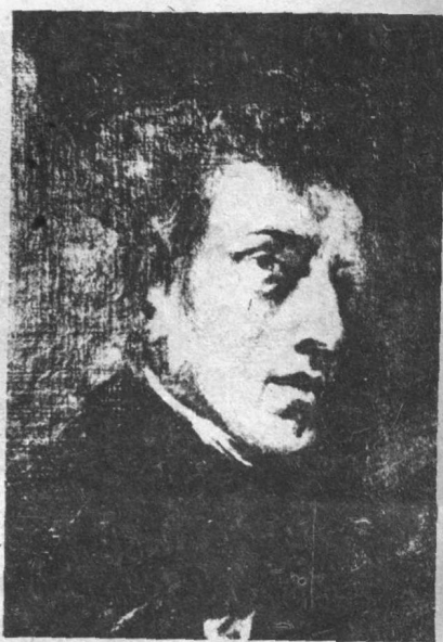
蕭邦(F. F. Chopin, 1810-1849)