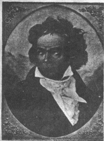
貝多芬(L. Beethoven, 1770-1827)