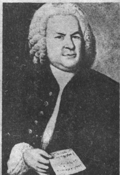
巴哈 (J. S. Bach, 1685-1750)