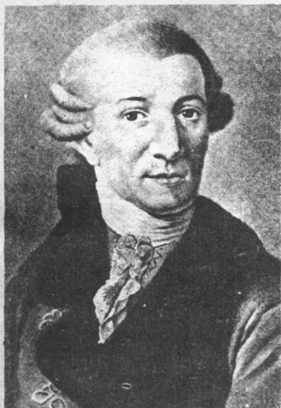
海頓(F. J. Haydn, 1732-1809)