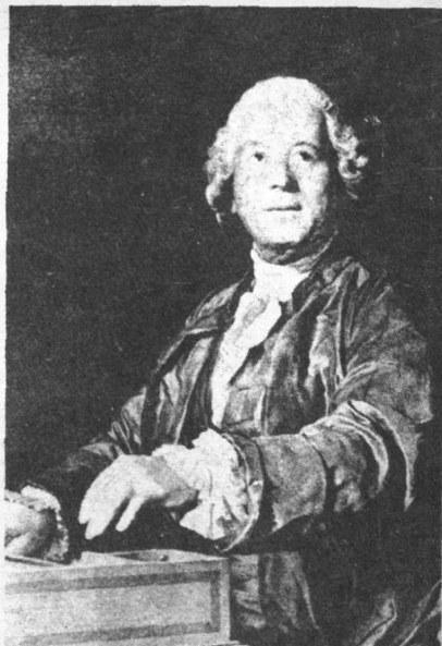
葛魯克(C. W. Gluck, 1714-1787)