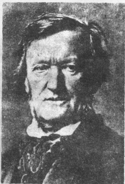
華格納(R. Wagner, 1813-1883)