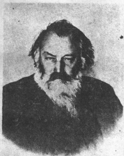
Johannes Brahms 布拉姆斯(J. Brahms, 1833-1897)