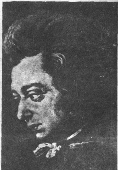
莫札特(W. A. Mozart, 1756-1791)