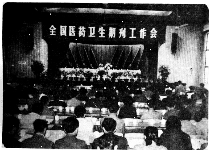
全国医药卫生期刊工作会议会场全景