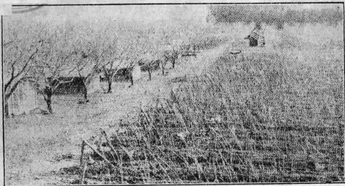
場鷄之內園菓場驗試根勒國美