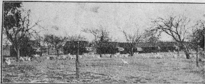
美國加利福利亞內園之雞場移動雞舍