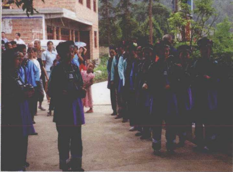
▲六屯乡独山村布依族妇女唱着山歌喜迎进寨宾客