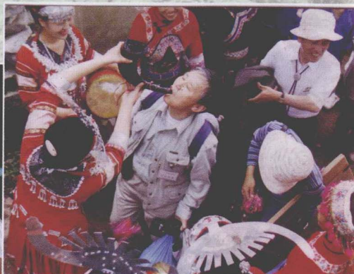
▲久长镇下堡村苗族载歌载舞用牛角酒迎接进寨宾客