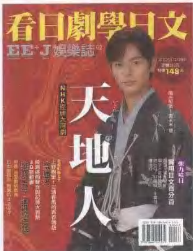
2010/01/27 出刊 封面人物：妻夫木聰