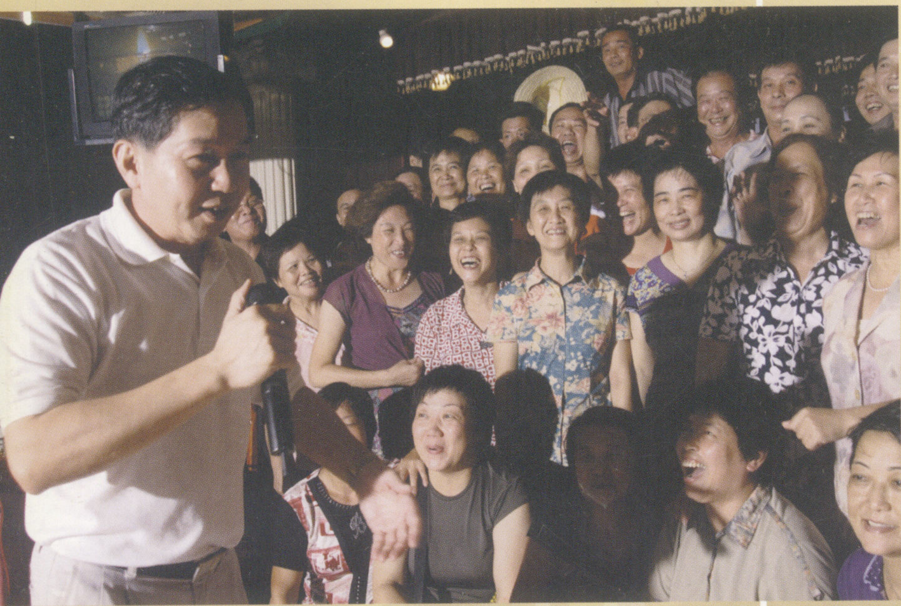
▲ 来，大家一起来张大合影