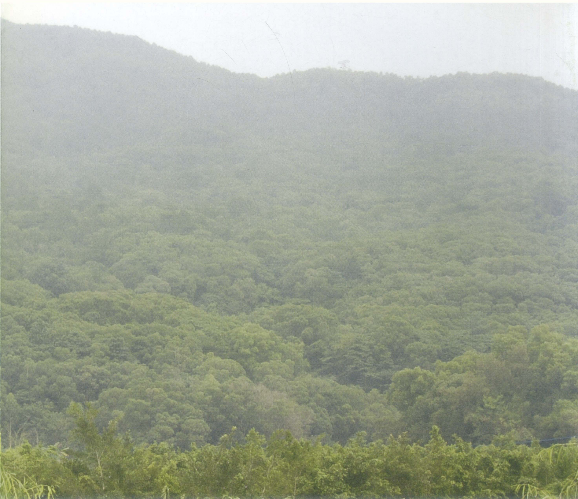
潮州红山果林场山前全景。