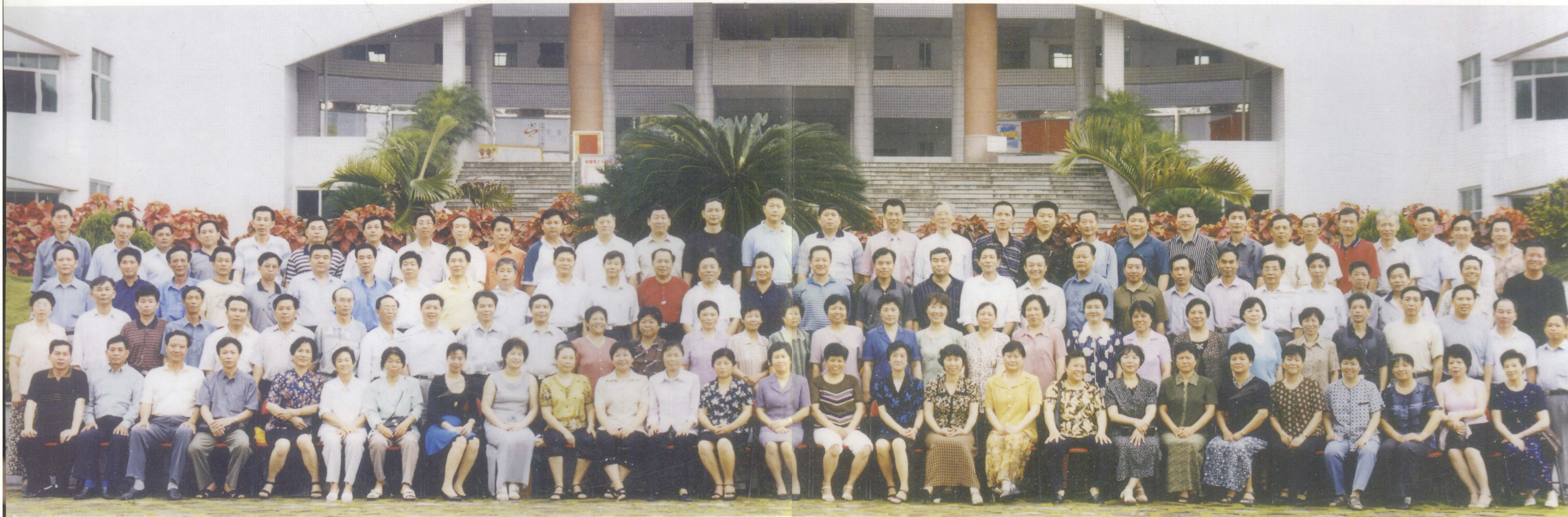
忆往昔岁月峥嵘 看今朝友谊长存 潮州市红山果林场下乡知青新世纪聚会 2001年5月19日