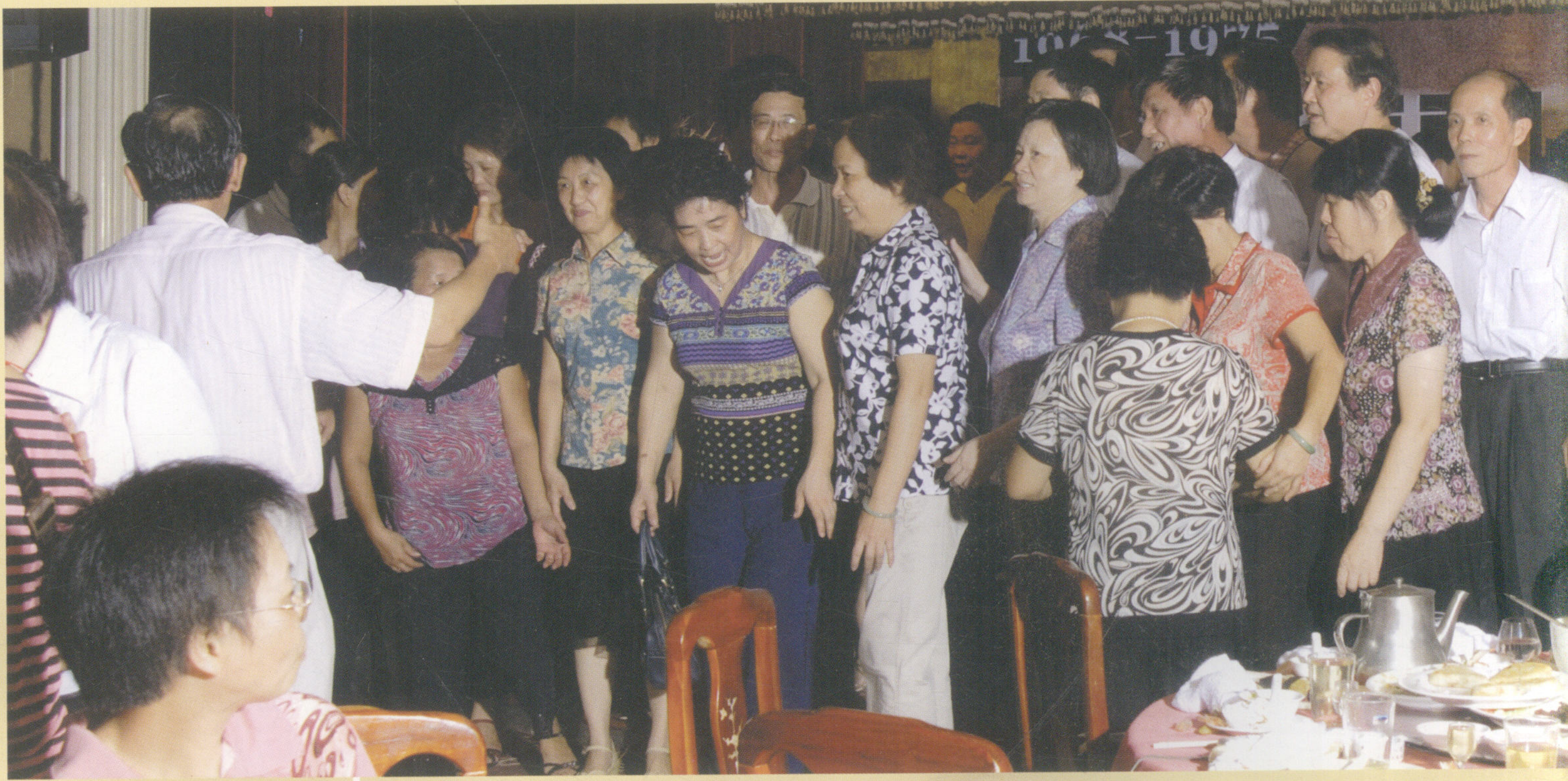
▲ 知青们纷纷合影留念