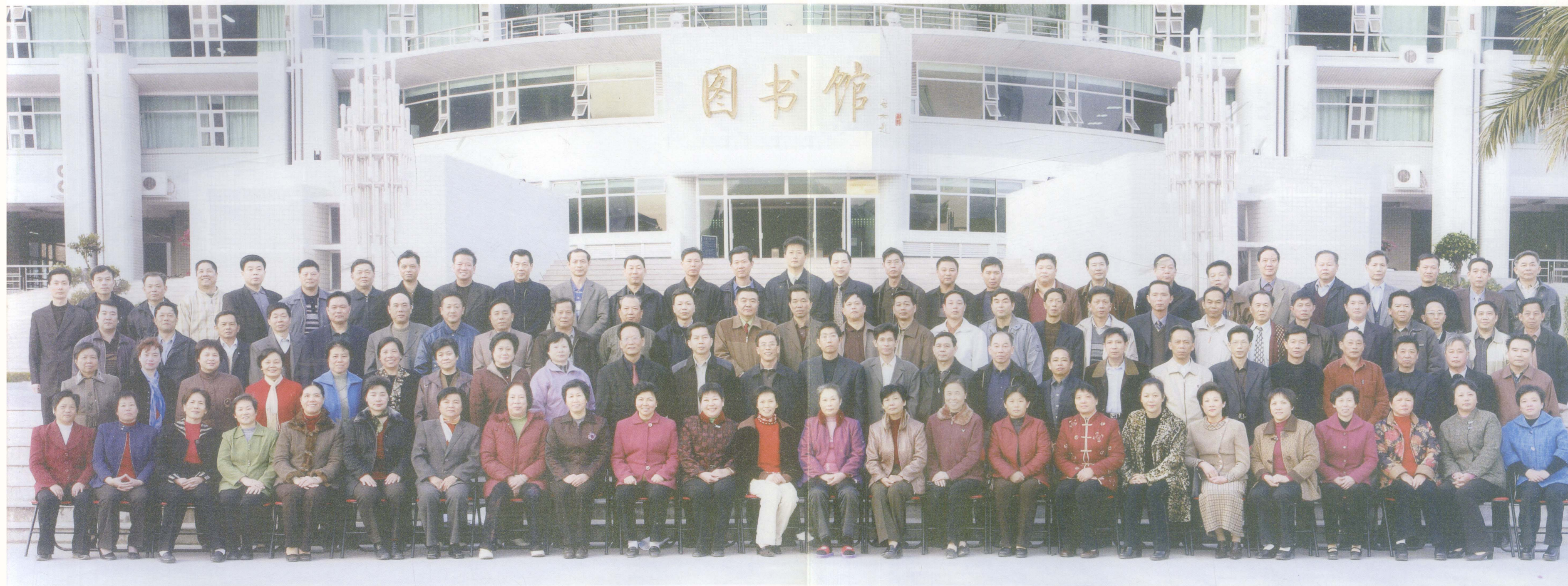
弹指卅五年岁月稠 笑迎未来风光好 潮州市红山知青聚会2003年12月