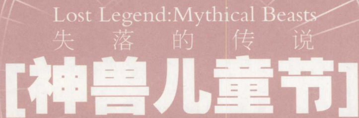
Illustration by 张旺 Narrator: 白北五

大家好，这期的出版恰逢儿童节，而张旺老师的爱子若海也在五月底喜迎周岁，作为欢乐幸福的父亲，张旺老师这期的《神兽》主题，采用了“幼年版”的形式。