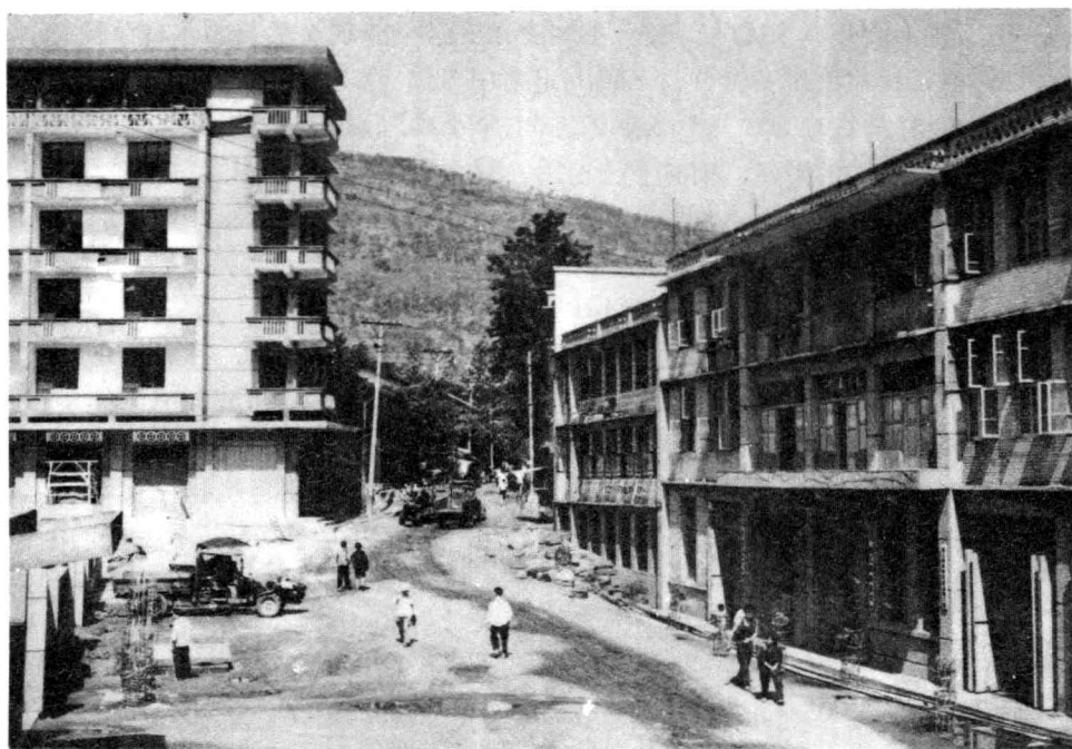
建设中的 县城主要 街道——金 江街。