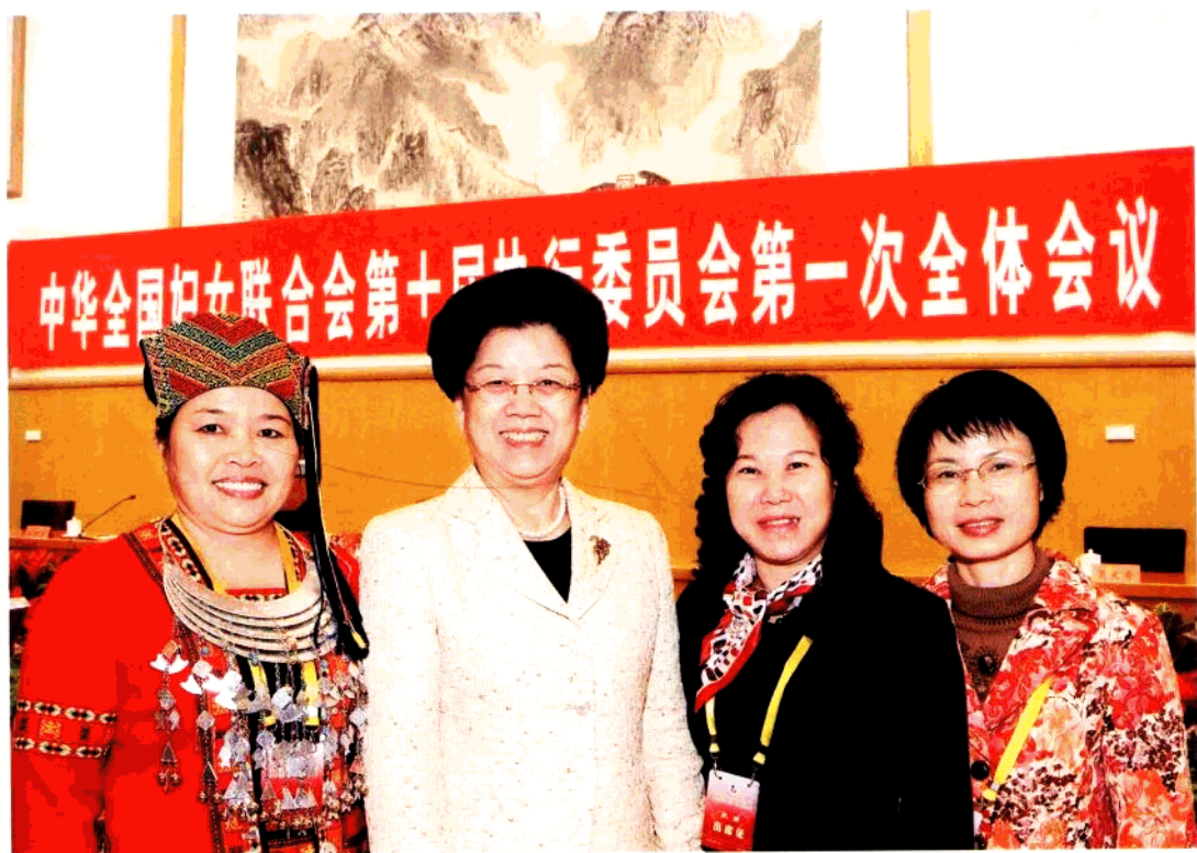
全国人大常委会副委员长、全国妇联主席陈至立（左二）与海南省中国妇女十大代表、全国妇联十届执委王琼珠（右二）、肖惠珠（右一）、刘海燕（左一）合影。