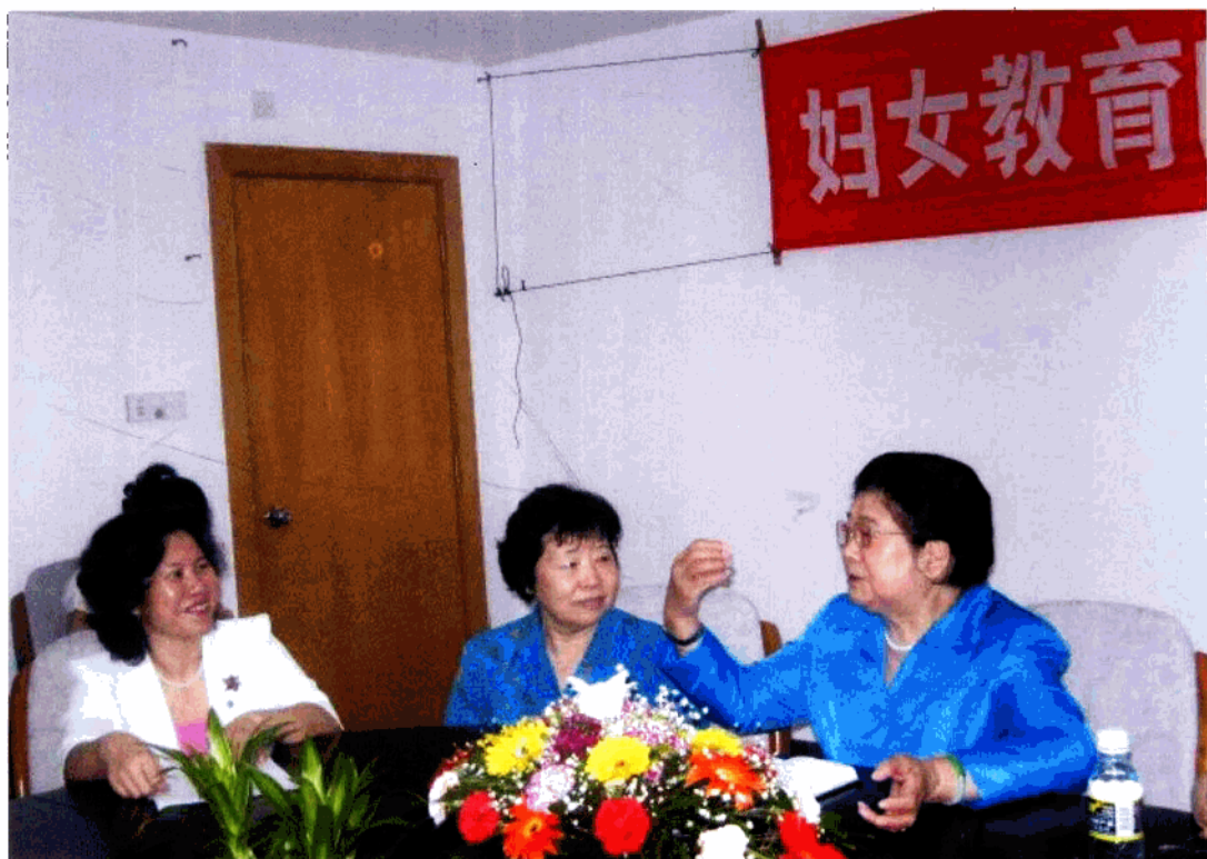
原全国人大副委员长、原全国妇联主席顾秀莲（右一）视察海南省妇联时，与原海南省人大常委会副主任王守初（右二）、省妇联主席王琼珠（右三）的影照。