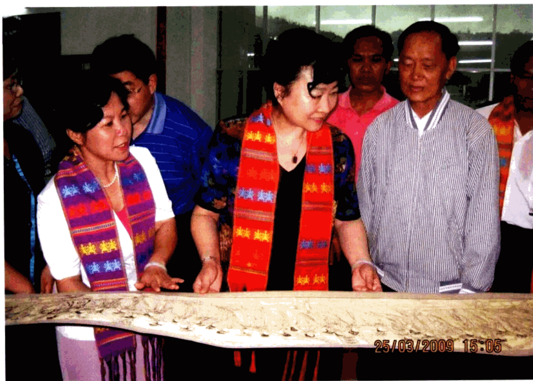
国家文化部副部长赵少华（中）考察五指山市黎锦苗绣基地