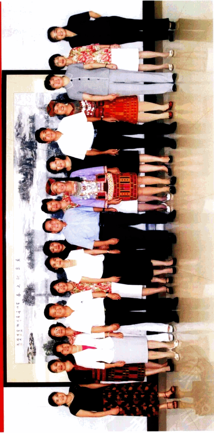
海南省委书记卫留成接见出席中国妇女十大的我省妇女代表——省委书记卫留成（右五）、省委副书记于迅（右三）、省委常委、秘书长许俊（右七）、省妇联主席王琼珠（右八）