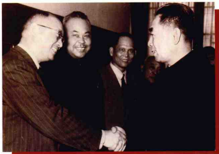
1957年周恩來總理于全國政協第二屆第三次會議時接見王寬誠先生。