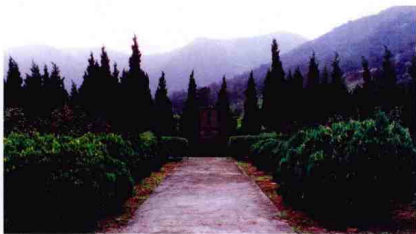
1989年4月22日，王寬誠先生的骨灰安放於風景秀麗的東錢湖畔，實現了他“魂返故里，葉落歸根”的遺願。