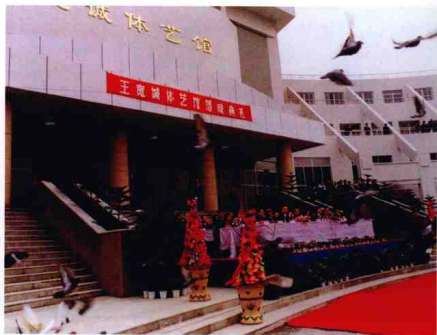
1999年4月4日，寧波致實中學隆重舉行“寬誠體育館”落成典禮