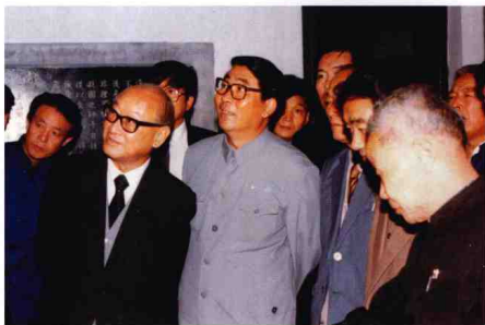
寬老（左二）回鄉時在奉化溪口參觀名勝古迹。