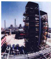
首套國產化80萬噸/年 加氫裂化裝置