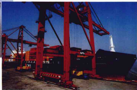
法國達飛輪船公司第4代國際集裝箱船“阿寶克斯”號靠泊北侖港集裝箱碼頭作業

French DaFli ship company 4th generation international container ship "A Bao Xi" is at anchor alongside Beilun container wharf