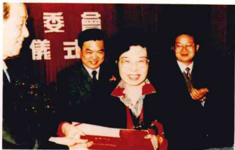
市人大常委會主任項秉炎向寧波市“榮譽市民”授證書

聞名遐邇的“寧波幫”，是寧波人尤其是寧波商人在開展商事活動中逐步形成并發展起來的一種群體稱謂，是歷史上著名的商幫。據有關資料統計，現有海外的寧波籍人士 73000 多人，加上他們的後裔就有 30 多萬人，分布在世界 64 個國家和地區。“寧波幫”在海外享有較高的社會名望，具有財力和智力的優勢。他們的經濟實力雄厚，擁有可觀的資金和產業，還擁有遍布世界的商業