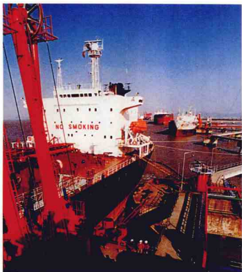
包括全國最大的25萬噸泊位在內的公司自備海運碼頭。

從八十年代末開始,鎮海煉化確立了國際化經營的戰略目標,多年來通過開展來料加工、進料加工和一般貿易,不斷擴大進口原油加工業務,積極參與國際競爭,並以此推動企業持續發展。1996年加工原油600萬噸,其中來自國際市場的原油占到80%以上。由於出色的經營業績,1995年、1996年公司分別榮獲“全國優秀企業(金馬獎)”和“全國思想政治工作優秀企業”等光榮稱號。