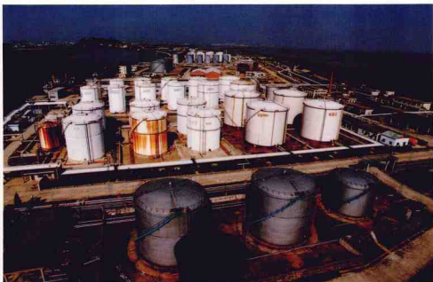
鎮海港液體化工碼頭儲罐群 Zhenhai harbour LPG and LNG wharf tins

0.3 Mio ton "Da Feng Feng" ship is at anchor alongside Beilun harbor