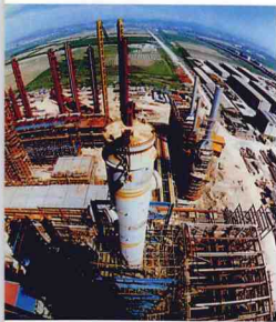
公司“九五”工程現場