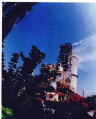
年產60萬噸尿 素的化肥裝置