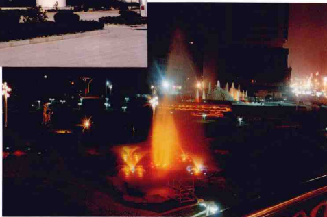
興建中的陽光廣場