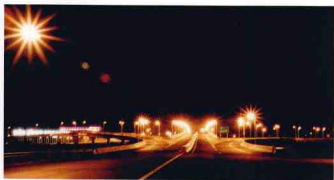
杭甬高速公路段塘立交橋