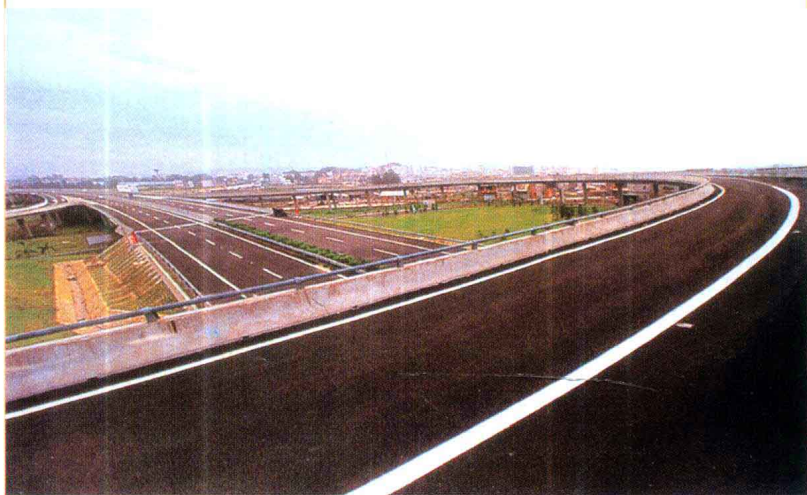
泉(州)厦(门)高速公路泉州段