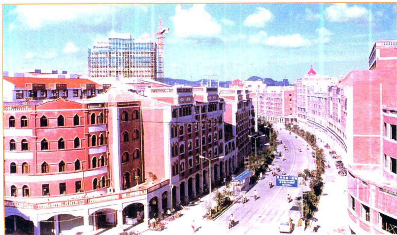
泉州市区旧城改造——东街一角