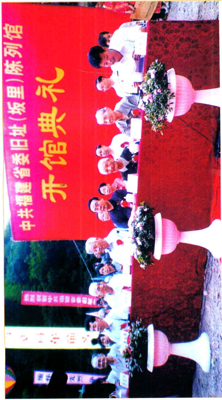
2003年6月27日,中共福建省委旧址(坂里)陈列馆在德化县水口镇坂里举行隆重的开馆典礼,省、市领导及老同志等出席了典礼仪式。