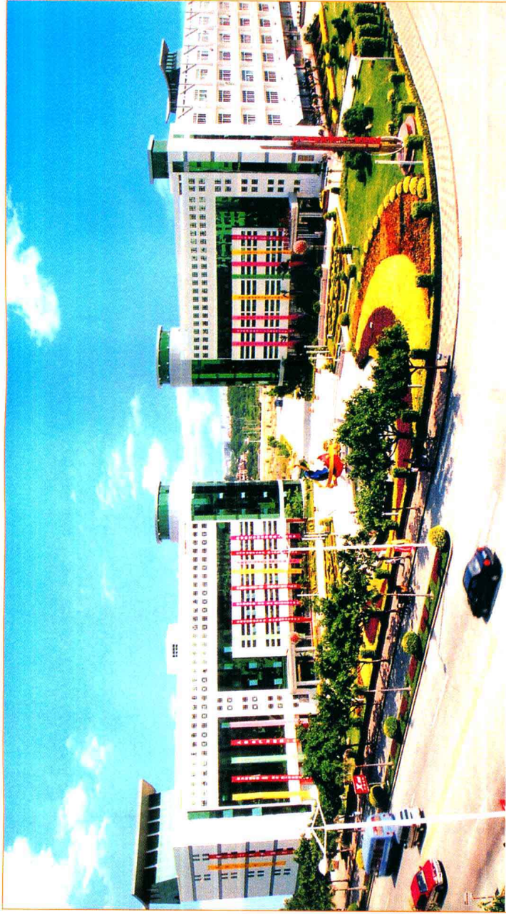
座落于泉州经济技术开发区的国家级高新技术企业孵化基地