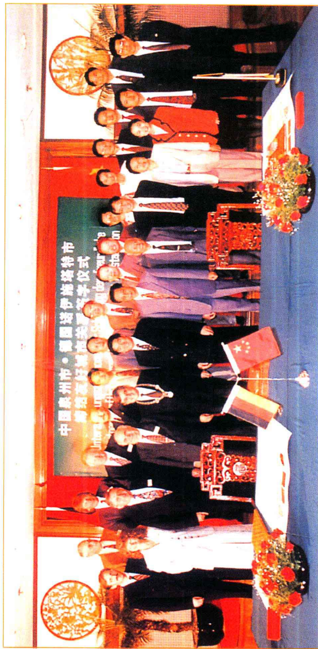
泉州与德国诺伊施塔特市缔结友好城市