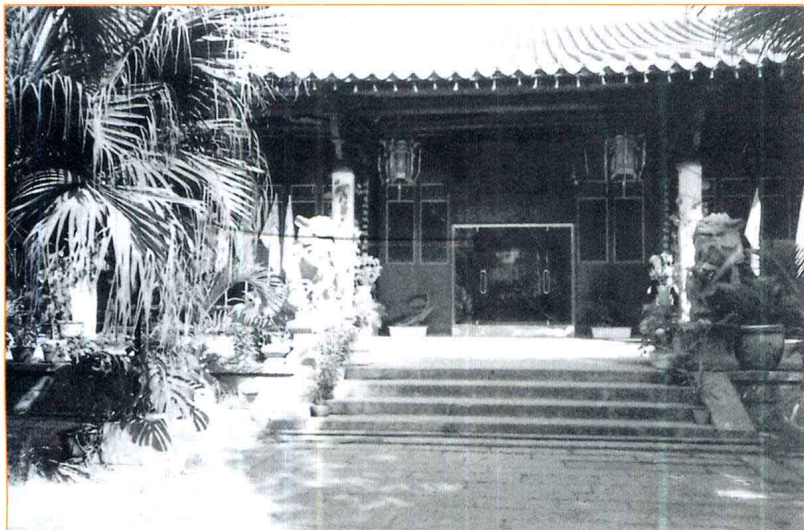
1927年1月,中共泉州特支成立于泉州明伦堂