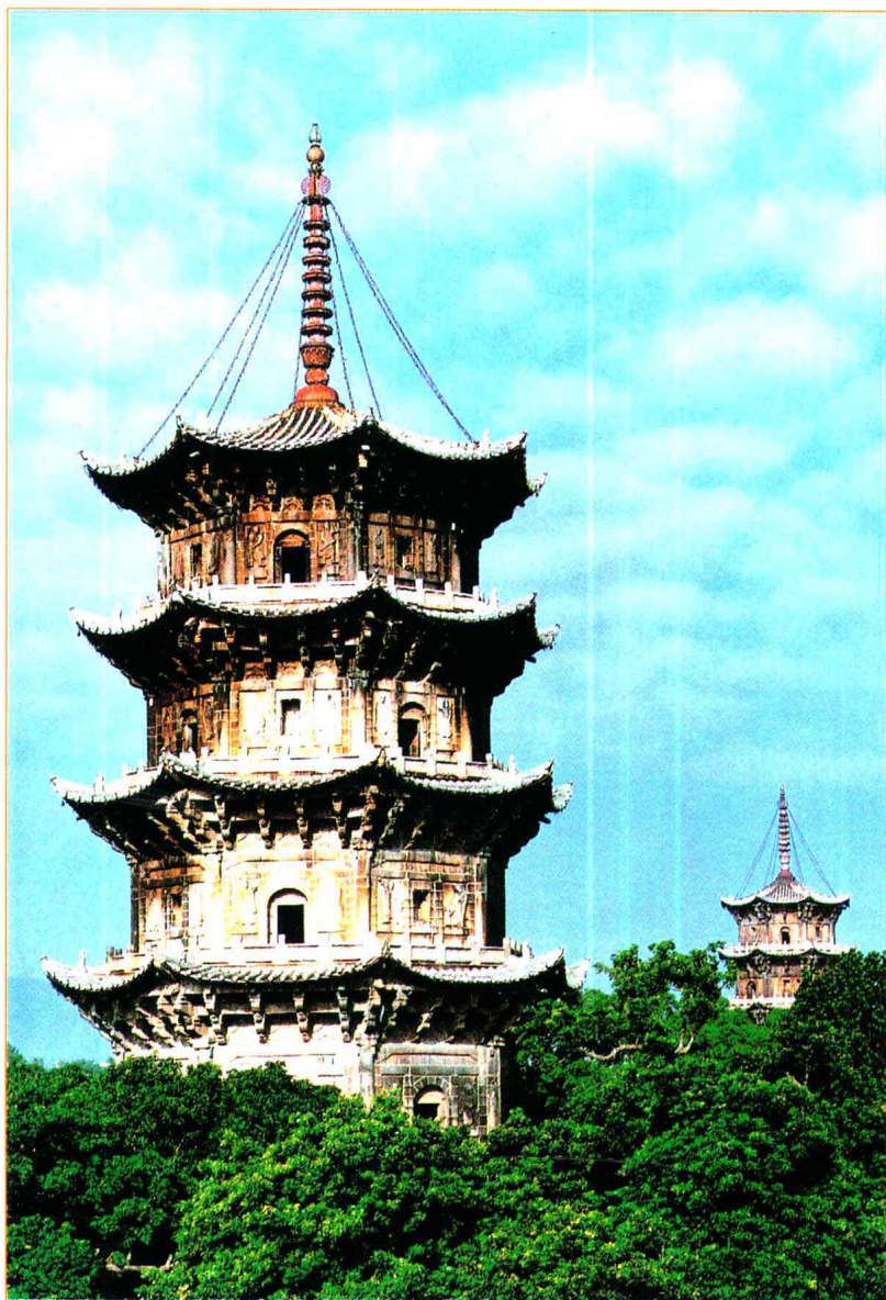
建于宋代的泉州古城重要表征——东西塔