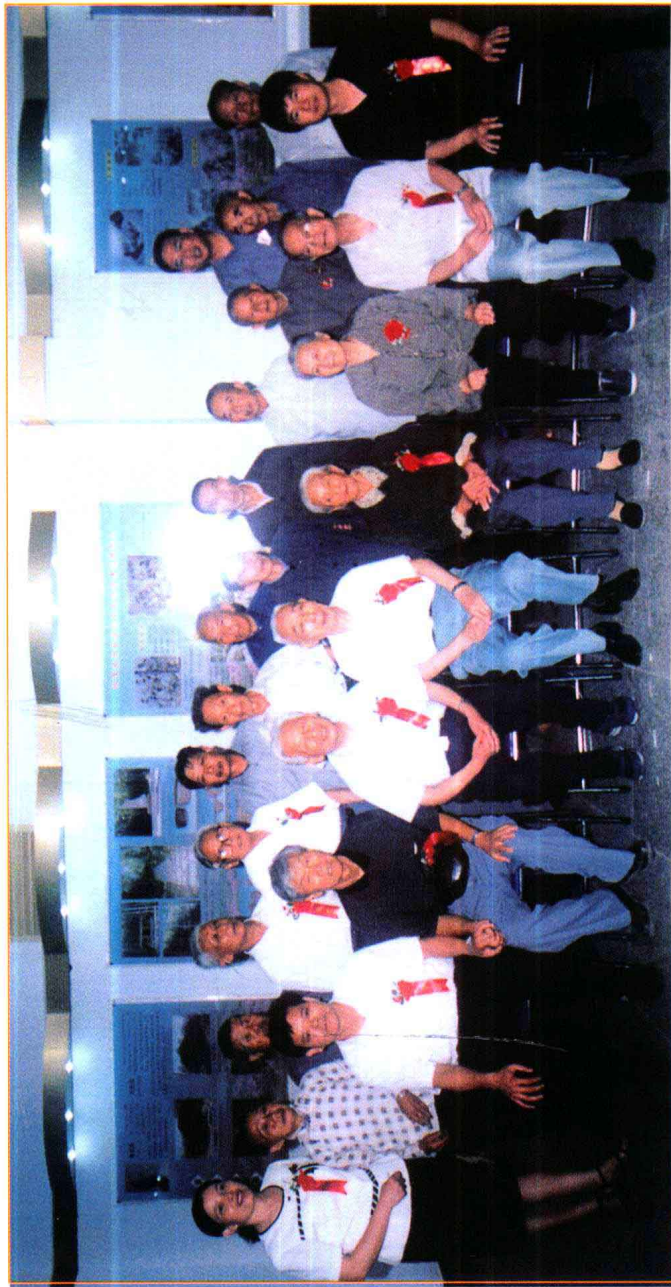
省、市、县老促进会领导及“五老”人员合影