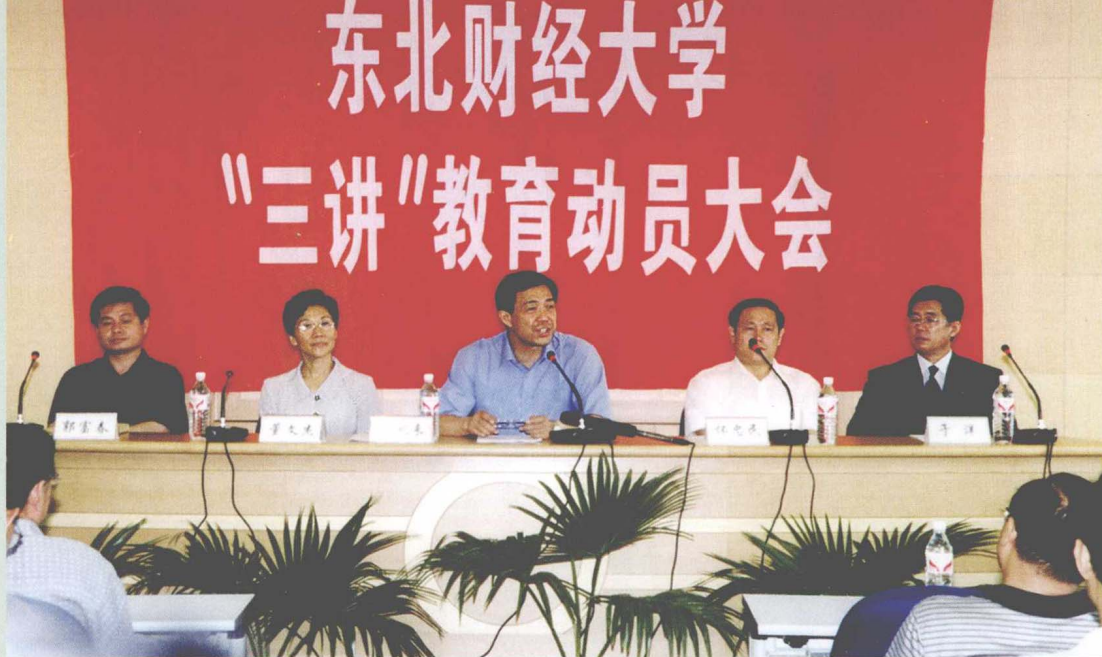
大连市委书记薄熙来在东北财经大学“三讲”教育动员大会上讲话