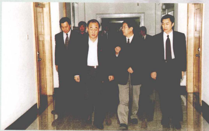
财政部副部长高强来我校视察