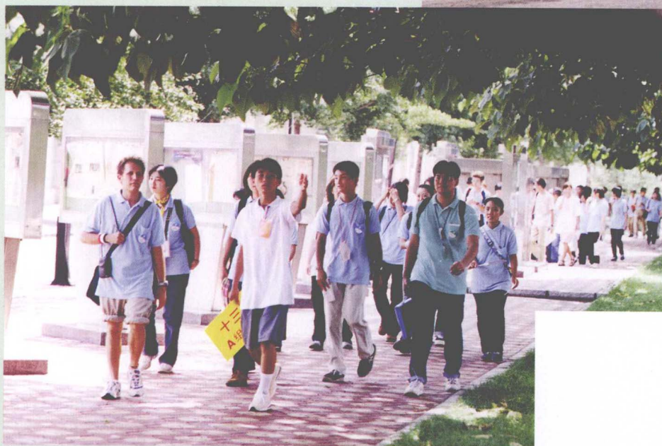
在我校大学生陪同下，日本近几青年洋上大学学生参观我校校园