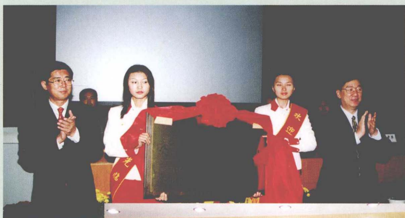
辽宁省电子商务培训中心 揭牌仪式