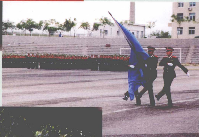
2000级学生军训阅兵仪式