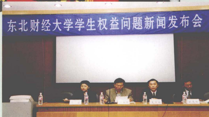
东北财经大学 学生权益问题新闻发布会