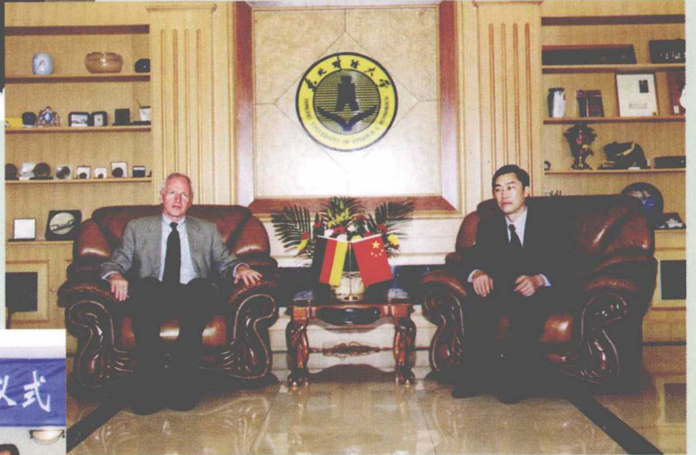
德国大使来我校访问