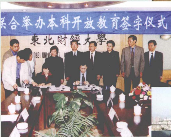
中央电大、东北财大联合举办本科 开放教育签字仪式