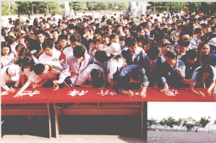
东北财经大学学生自律宣言签名活动