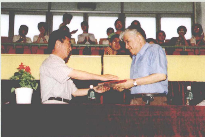
“人民表演艺术家”李默然 来我校作报告并受聘为我校荣誉教授