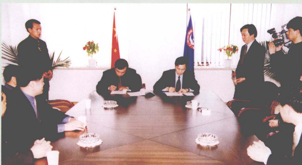
东北财经大学与大连民勇集团联合共建学生服务大楼签字仪式