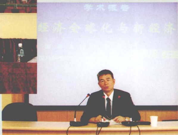
著名经济学家 乌家培教授来我校讲学