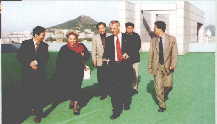
法国拉弗尔市市长来我校访问