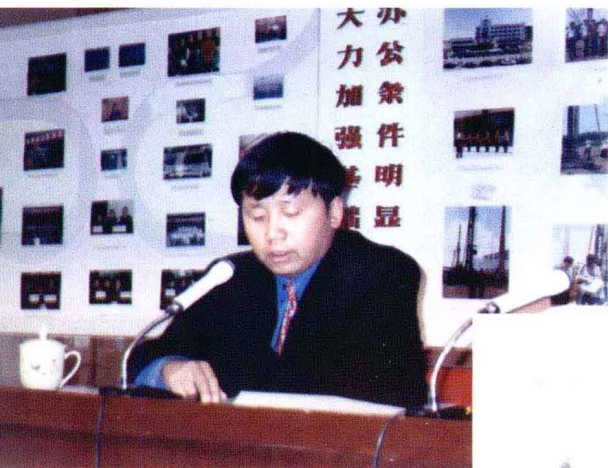
←1995年在市委组织部组织员办公室时的工作照