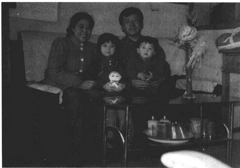
1990年冬作者同妻子、儿女在父母家里合影