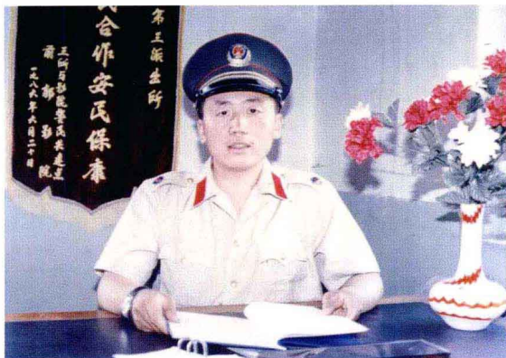
1986 年在前郭县第三派出所时的工作照