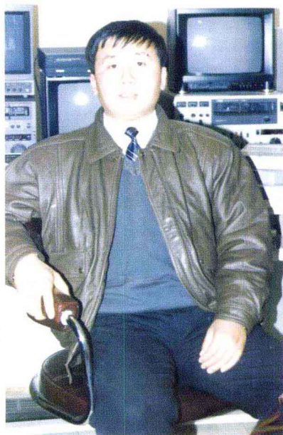
1994 年在市委组织部电教中心工作时的工作照