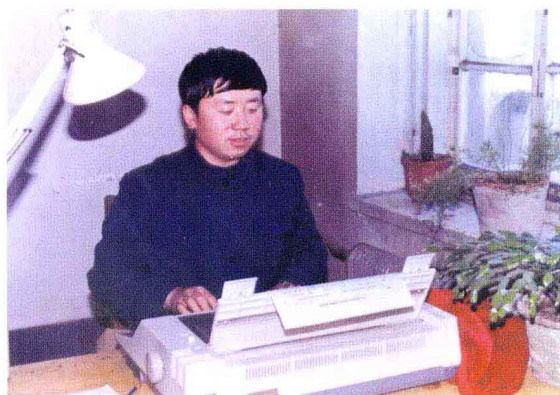
1991 年任前郭县委组织部秘书科长时的工作照

Page _____ Date _____ 月亮暗的地亮了。 月亮村有个管空巴脚之木匠，名叫大栓。第二栓在十八里外小路上做工，每日跨车往返。大栓有个伶俐的媳妇，名叫月娥。月娥漂亮，月亮村也感到骄傲，但月亮也常与月娥带来不快和烦恼，一些手段狡猾的野男人，暗地里偷上她打月娥之主意，还有一些别有用心之人，造谣说月娥和小第二栓如何如何， 弄得月亮村风 刮 。把个空巴脚之小村子搅开了锅。二栓不以为意，他常说身子不怕累子斜，虽没有成家，他同妻子生活在一起，也算和睦幸福。大栓也知道从小花自巴那边长大的第二。可有时