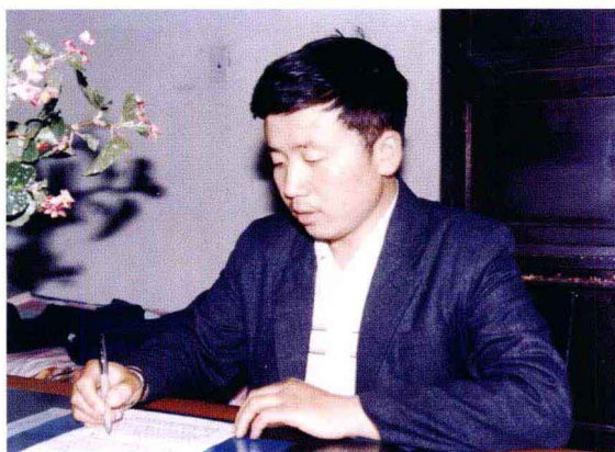
1989 年在前郭县委组织部任干事时的工作照