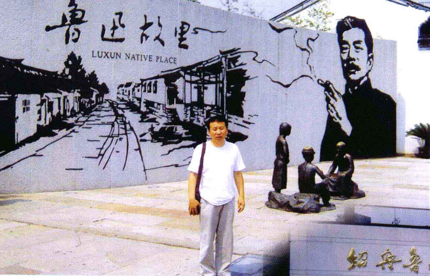
2005年9月作 者在鲁迅故里留影