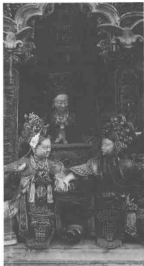
佛山祖廟瓦脊人物陶塑（局部） 清代

陶瓷雕塑藝術的發展和其他事業一樣，需要一個安定的盛世。鴉片戰爭以後，中國淪為半殖民地半封建社會，戰亂頻繁。辛亥革命成功，人們期望大治有望，可惜太平短暫，接踵而來的却是軍閥混戰。特別是日本侵略軍大舉入侵，鐵路踐踏大半個中國長達八