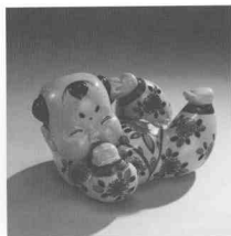
胖娃娃·青花鬥彩瓷塑 1983·康家鐘