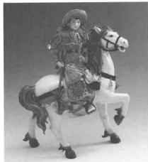
木蘭從軍·白釉加彩瓷塑 1977·曾山東

福建德化瓷塑採用本地特產白瓷土，胎釉如脂，質潔無瑕，光下透視呈半透明狀，故又稱象牙白，歐洲人直稱中國白。這一得天獨厚的稀世材質，是構成其地方風格的重要因素。當代德化瓷塑藝術仍能清晰地看到明代何朝宗的影響，何派風格善於汲取木雕與泥塑的造型之長來豐富自己，並結合瓷塑的工藝特點，富有創新精神，故其作品不流於一般化和庸俗化。他開創捏、塑、雕、刻、鏤、堆、接、修八字技藝，經歷代藝人的承繼和發展，形成了德化瓷塑精