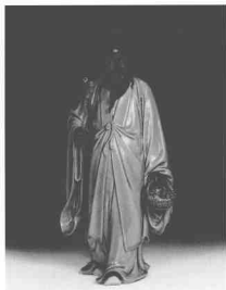
東坡啖荔·灰白釉陶塑 1981·劉澤棉

80 年代以來，中國的傳統陶瓷雕塑取得了突出的成就，隨着改革開放的大潮，現代陶藝出現在中國的藝壇，石灣、景德鎮、宜興和國內高等藝術院校的陶藝家們，紛紛嘗試和實踐，汲取西方現代陶