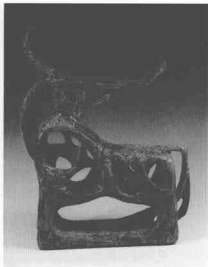
牛·無光釉陶塑 1984·梅文鼎

我國的現代陶藝正處於發展中，已吸引大批專業人士和眾多的愛好者共同參與創作之中，預示它將會有一個更為廣闊的發展空間。多種藝術形式的涌現本身就是中國陶瓷雕塑藝術興旺發達的有力證明。從追求藝術的真、善、美出發，去發展和完善，這正是現代中國陶瓷藝壇一種健康向上的主流。