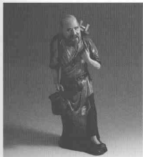
漁翁·色釉點彩瓷塑 民國初·曾龍升

年之久，使整個民族工業陷於停頓狀態，陶瓷業摧殘尤甚，各省、市的陶瓷產區的工廠、作坊紛紛倒閉和停產，面臨着人亡藝絕的境地。