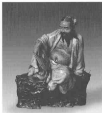
漢鍾離·青釉陶塑 民國初·潘鐵遠

前半世紀，舉步維艱的中國現代陶瓷從風雨中走來，隨着歷史的進程，新中國的誕生，迎來了一個百廢俱興的新時代。陶瓷雕塑