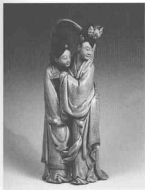
貴妃醉酒·灰青釉陶塑 民國初·潘玉書

名瓷特色，施釉又與眾不同，喜用乳綠、乳藍、乳黃、灰黑等色釉，自成一格。他善於細緻觀察生活，能抓住典型動態來刻畫人物的個性，其代表作有《拍蚊公》等。