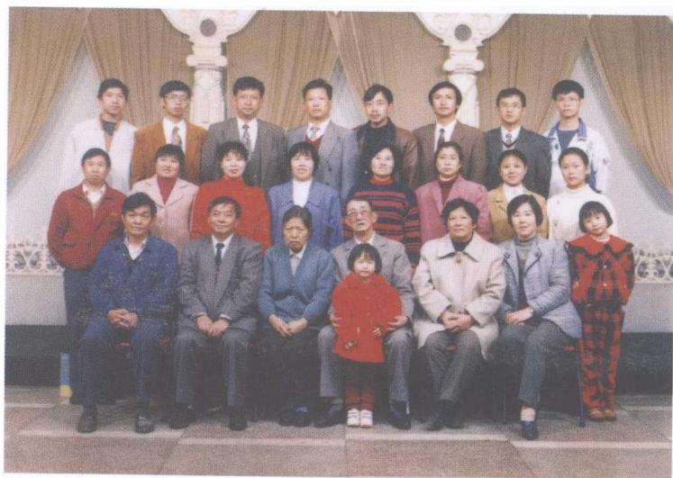
全家福（摄于一九九六年）