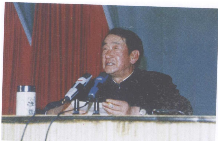
一九九零年三月二十七日在纪念昭通解放四十周年（三月三日）纪念大会作报告。