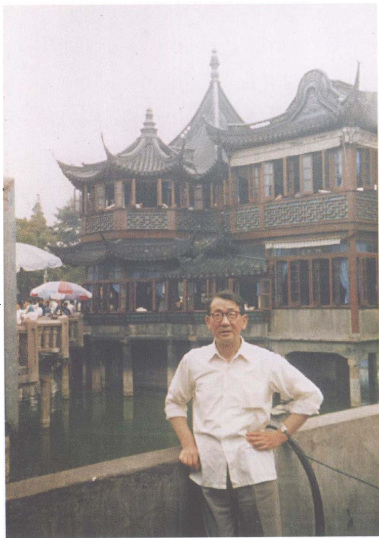
一九八七年六月二十一日于上海豫园（城隍庙）。