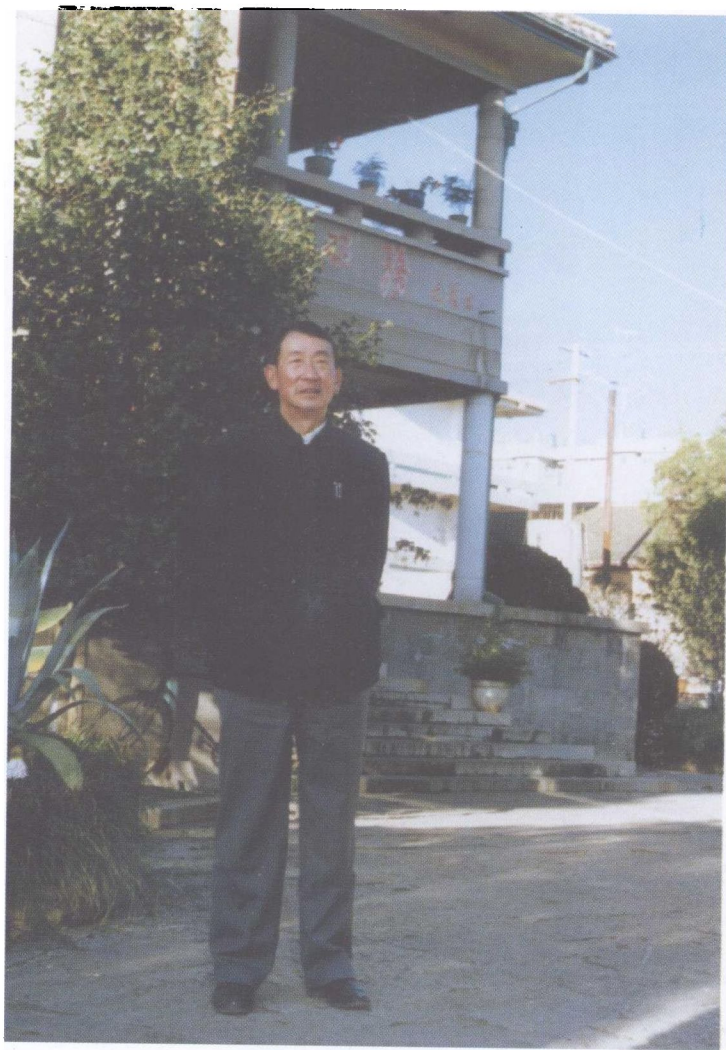
一九八八年十月十九日（戊辰重九）首届 敬老节摄。