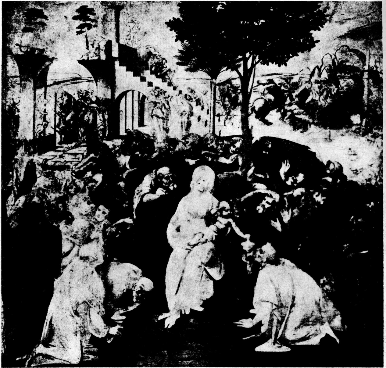
8 三王礼拜 1481 板面油画, 246×243厘米 佛罗伦萨美术馆

〔注〕这是当时很多画家画过的题材, 描写基督教传说中三个东方的国王前来朝拜圣母的场面。