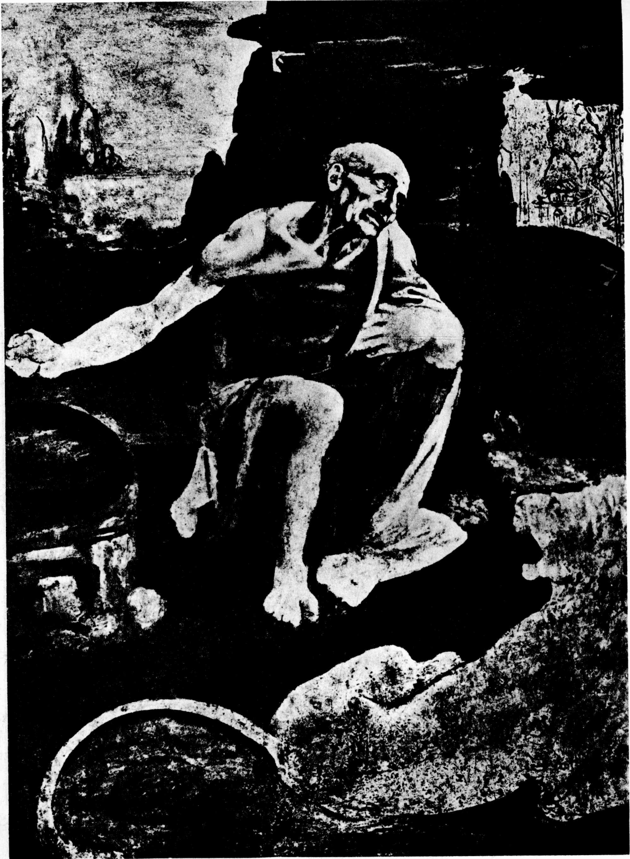
6 圣吉罗尼摩 1478—80 板面油画，103×75厘米 梵蒂冈