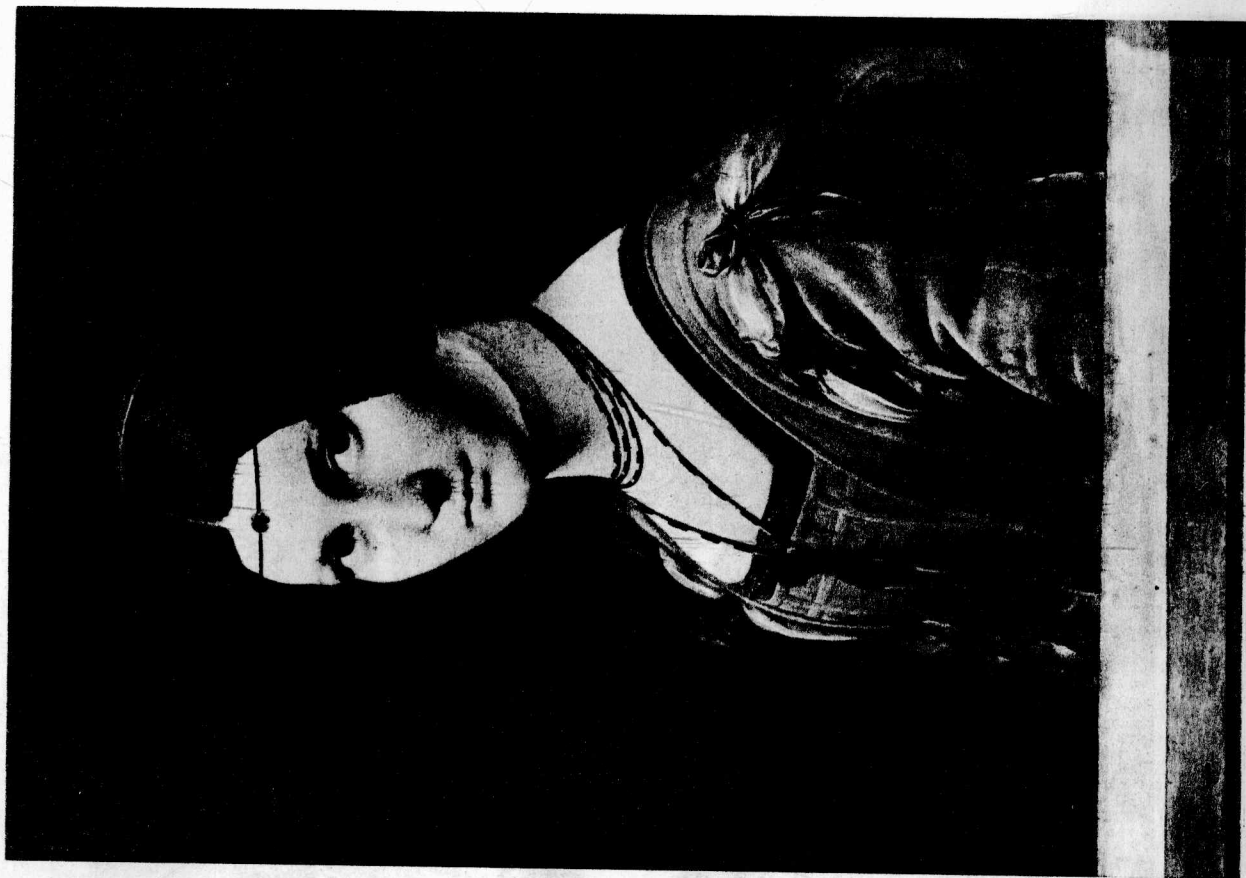
12 拉·贝尔·弗罗尼艾像 约1490 板面油画，62 × 44厘米 巴黎卢佛尔博物馆