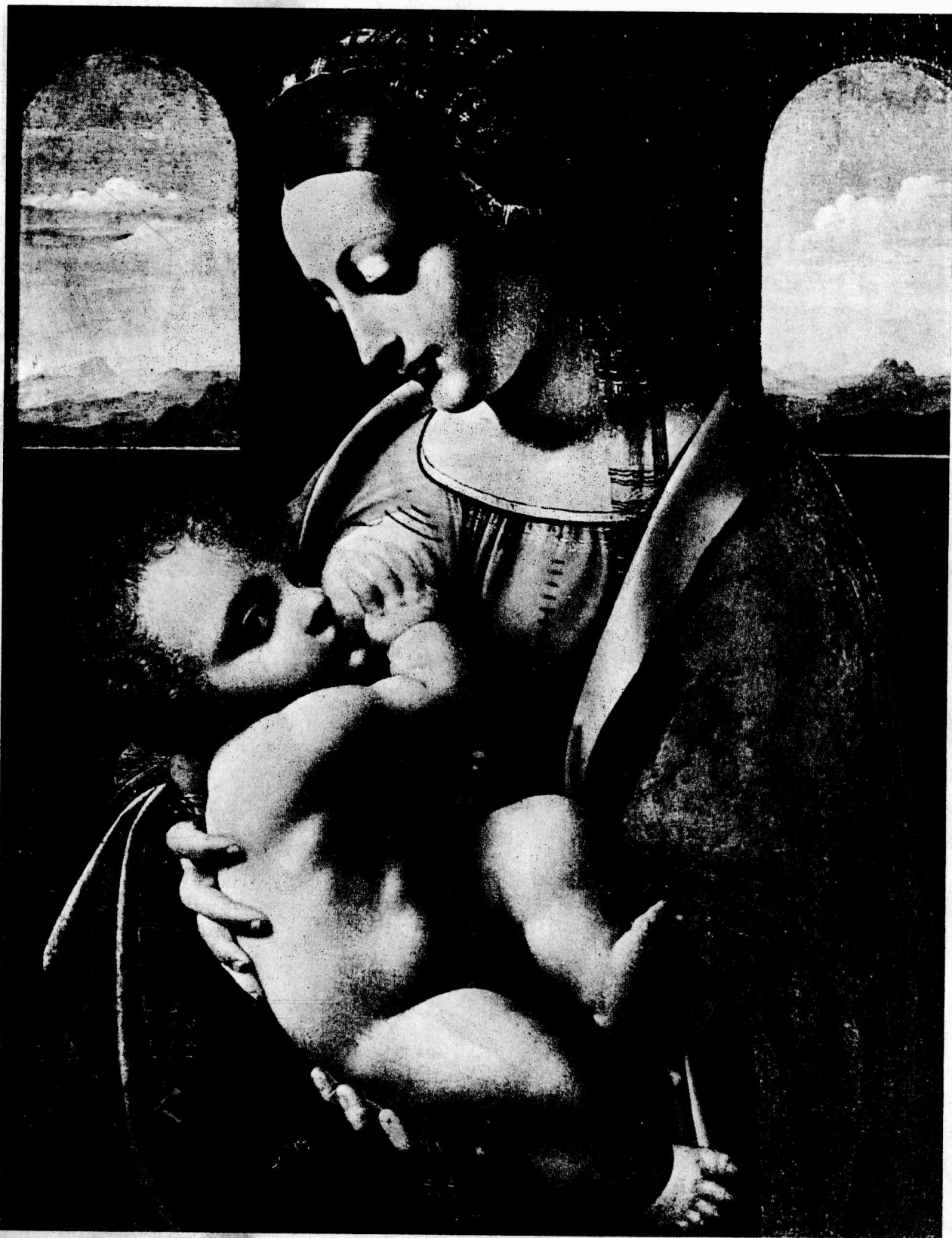
5 哺乳的圣母 约1490 巨贝拉画，42×33厘米 列宁格勒埃尔米塔什