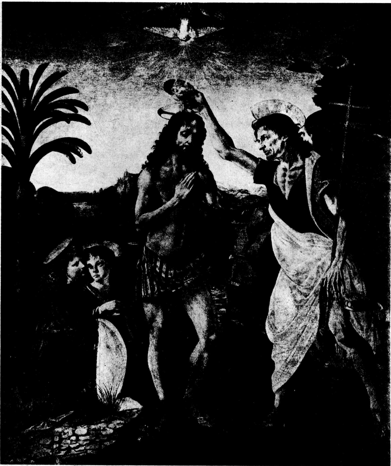
1 基督的洗礼 约1473 板面油画, 177×151厘米 佛罗伦萨乌菲齐美术馆