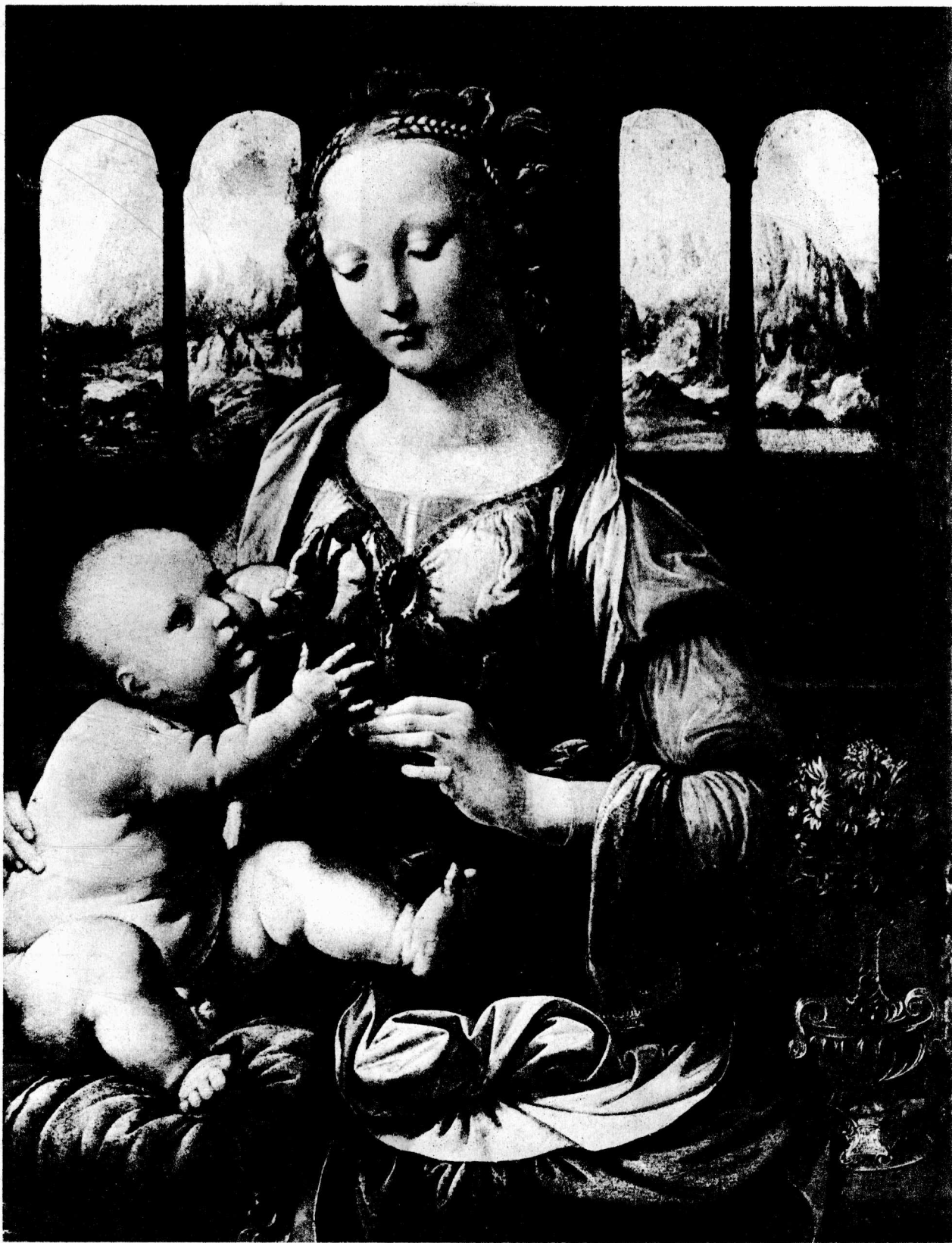
3 加罗法诺的圣母 约1475年 板面油画，62×47厘米 慕尼黑美术馆