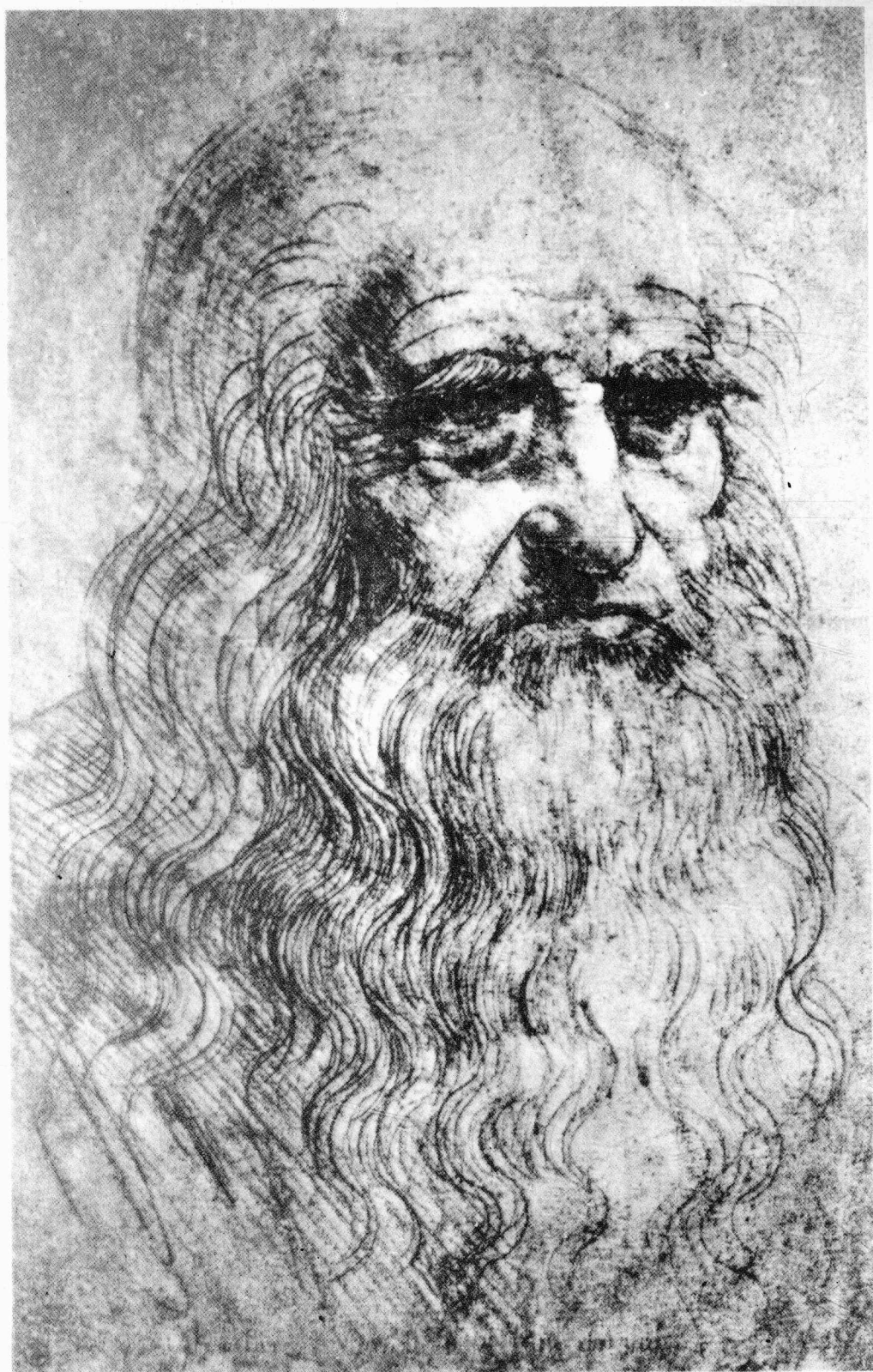
自画像 1510—13 红粉笔素描, 33.3×21.3厘米 都灵图书馆