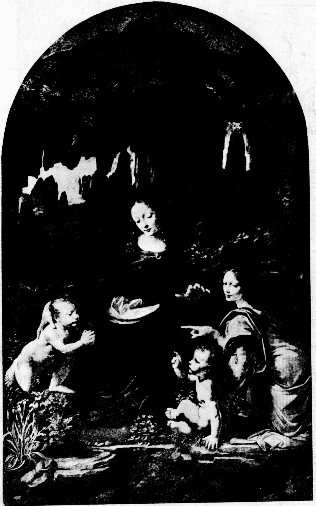
13 岩间圣母 1483 油画, 198×123厘米 巴黎卢佛尔博物馆