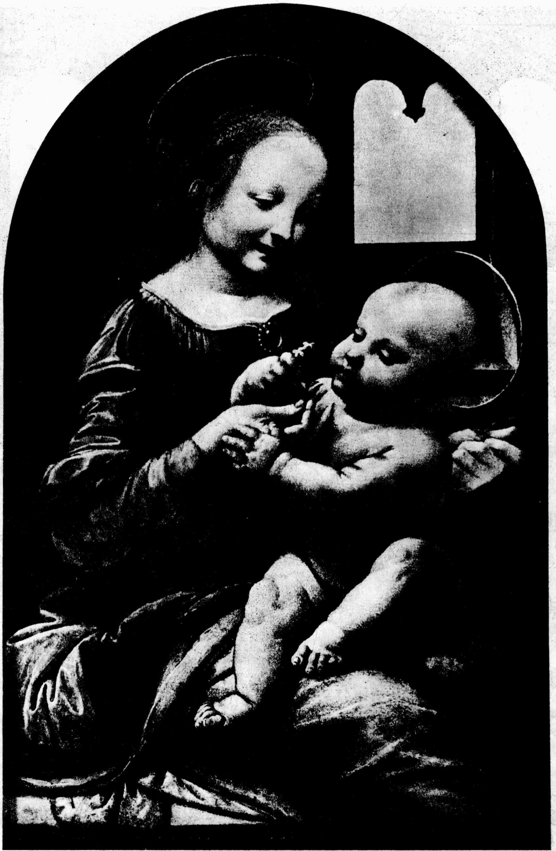
4 贝奴亚的圣母 1478—79 油画，49.5×31厘米 列宁格勒埃尔米塔什