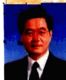
胡錦濤 Hu Jintao

中共中央政治局常委 Member of the Standing Committee of the Political Bureau of CPC Central Committee 全國人大常委會委員長 Chairman of the National People's Congress Standing Committee