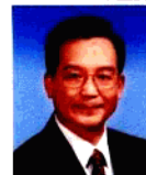
溫家寶 Wen Jiabao

中共中央政治局常委 Member of the Standing Committee of the Political Bureau of CPC Central Committee 中國人民政治協商會議全國委員會主席 Chairman of the National Committee of the Chinese People's Political Consultative Conference