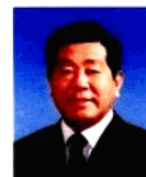
賈慶林 Jia Qinglin

中共中央政治局常委 Member of the Standing Committee of the Political Bureau of CPC Central Committee 中華人民共和國副主席 Vice President of the People's Republic of China