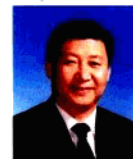
習近平 Xi Jinping

中共中央政治局常委 Member of the Standing Committee of the Political Bureau of CPC Central Committee 中華人民共和國國務院副總理 Vice Premier of State Council of the People's Republic of China