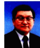
李長春 Li Changchun

中共中央政治局常委 Member of the Standing Committee of the Political Bureau of CPC Central Committee 中共中央政法委員會書記 Secretary of the Committee of Political and Law under the CPC Central Committee