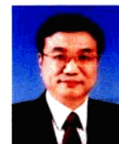
李克強 Li Keqiang

中共中央政治局常委 Member of the Standing Committee of the Political Bureau of CPC Central C 中共中央紀律檢查委員會書記 Secretary of CPC Central Committee for Discipline Inspection