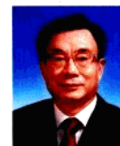
賀國強 He Guoqiang

中共中央政治局常委 Member of the Standing Committee of the Political Bureau of CPC Central Committee