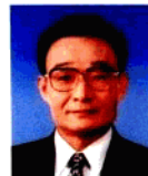
吳邦國 Wu Bangguo

中共中央政治局常委 Member of the Standing Committee of the Political Bureau of CPC Central Committee 中華人民共和國國務院總理 Premier of State Council of the People's Republic of China