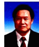
周永康 Zhou Yongkang

Note: Names underlined with red line, are members of the 17th CPC Central Committee.