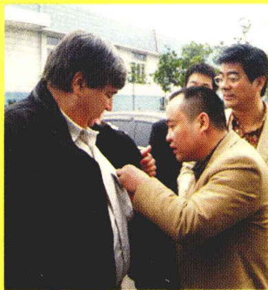
互赠随身佩戴的纪念章