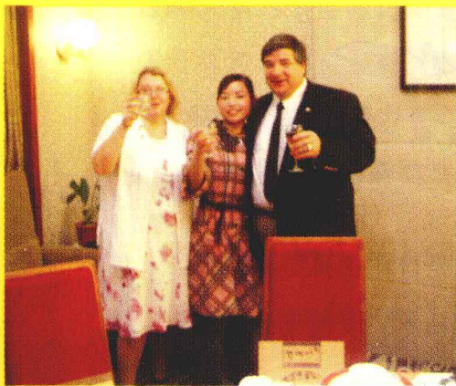
盖利本尼先生及夫人与贡莲皇员工合影