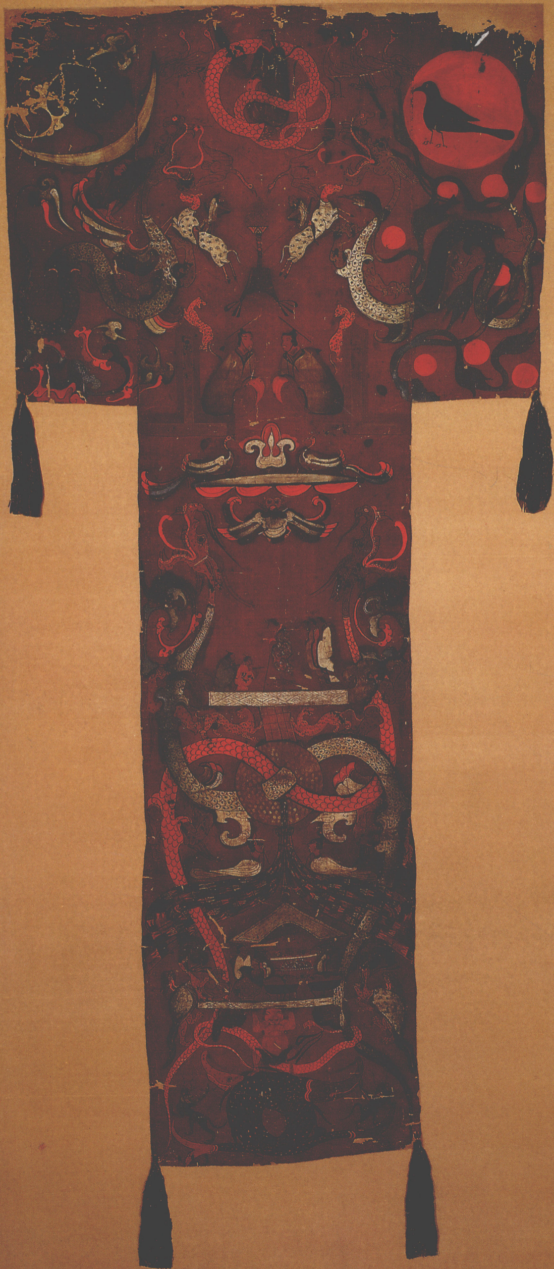
1 一號墓T形帛畫局部(前頁)