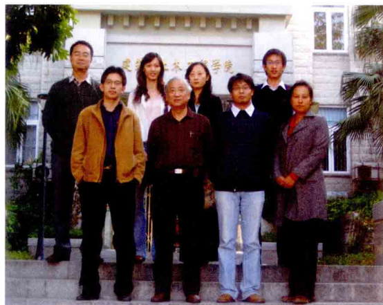
城市规划系部分教师合影留念

随着我国改革开放的深入和社会的快速发展，城市规划人才的需求量不断增大，规划人才供不应求。在福建省城市规划人才尤其紧缺，许多国内的建筑和规划专家到我校视察，纷纷建议可依托建筑与土木工程学院设立城市规划专业，将有助于整合厦门大学现有的城市研究资源，提升研究水准。在朱崇实校长及其它校领导的高度重视、关心和支持下，2006年10月决定筹办城市规划系，2007年1月上报教育部审批并获批准，今年秋季已开始招收了第一届城市规划本科生。