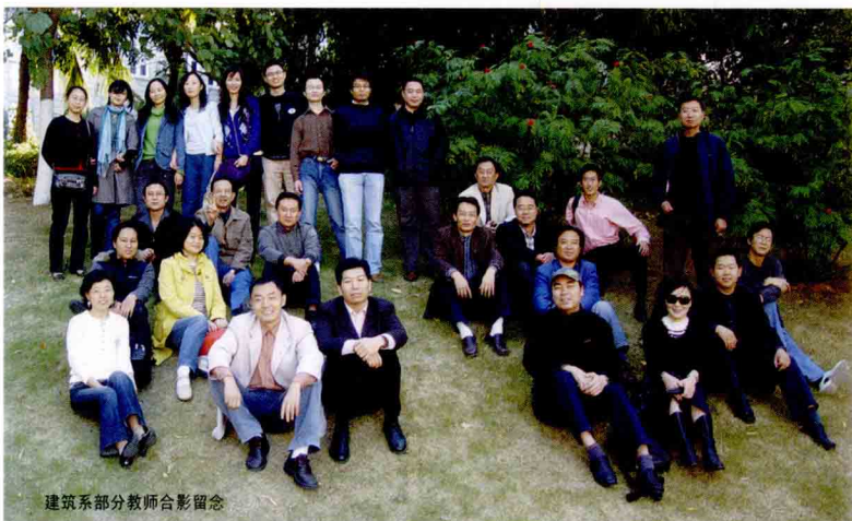
建筑系部分教师合影留念