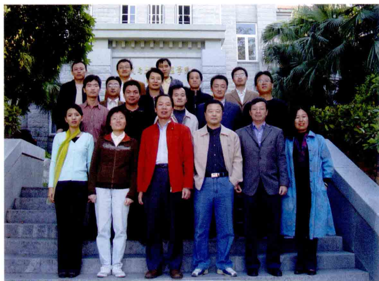
土木工程系部分教师合影留念

随着1987年建筑系的成立，为实现建筑学与土木工程两个专业的配套，节省办学资源，实现教学互补，在办好建筑学专业的同时。1993年和1995年相继成功培养了两届工业与民用建筑专业大专生，受到用人单位的欢迎与好评。1997年经学校同意，每年在建筑学专业的学生中挑选部分数理基础较好的学生学习结构工程，按专业方向进行培养同时积极引进专业教师为恢复土木工程专业作准备。1999年学校申请并经教育部批准，恢复了土木工程专业并开始招生。2003年获“结构工程”专业硕士学位授权点。2005年获“土木工程”和力学一级学科硕士学位授予权。