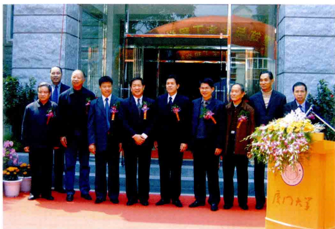
校领导和厦门市领导为学院揭牌

厦门大学建筑与土木工程学院是在原建筑系的基础上于2004年4月成立，现设有建筑系、土木工程系、城市规划系并设有与学科联系密切的建筑设计研究院（甲级）。学院现有教职员76人，其中专任教师56人，教授12人、副教授17人，具有博士、硕士学位的教师49人。教师来源广泛、结构合理，年富力强，富有朝气和活力。