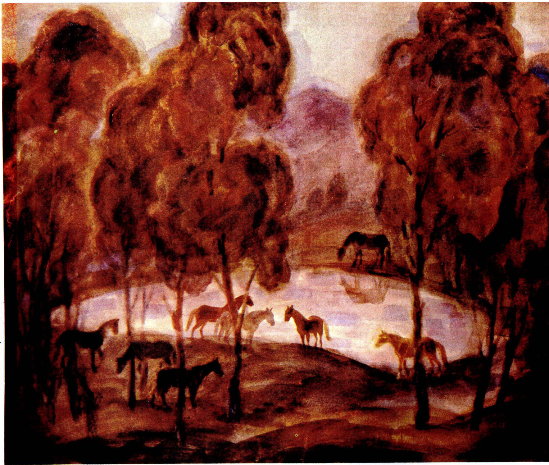
9 湖边暮色——《在卡尔巴特》组画之一 1980——1981年 58 × 69 cm P · C · 鲍伊木