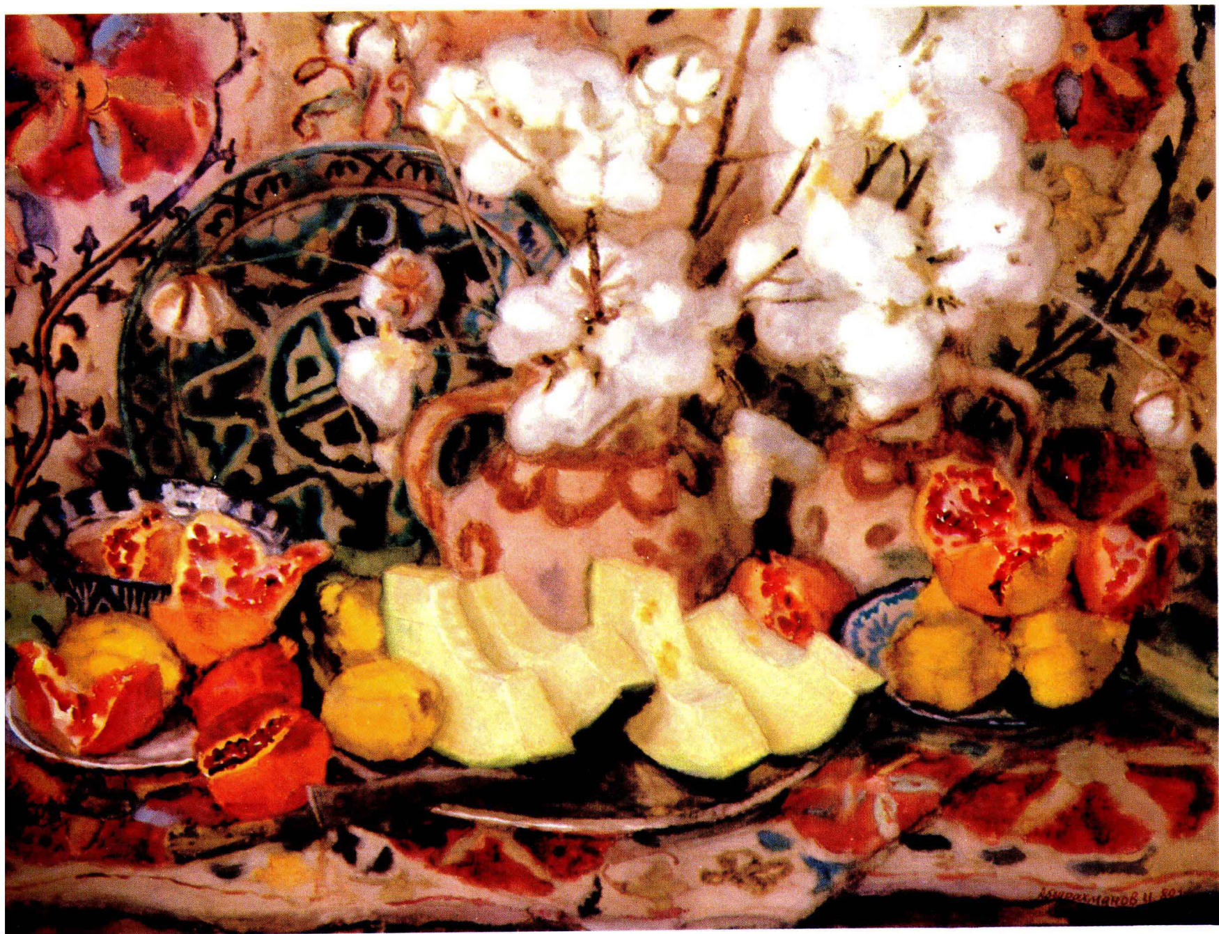
1 我富饶的边疆 1980年 51×68 cm