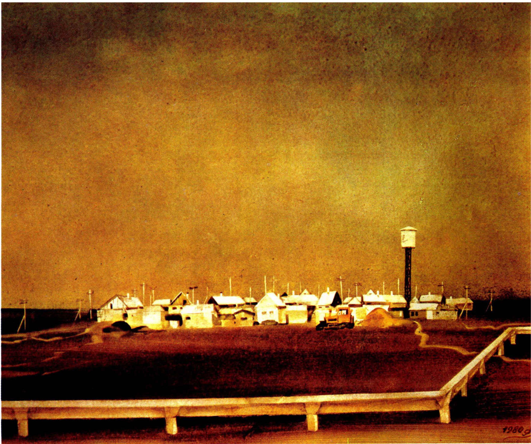
2 《日扎克斯基草原上的新收获的粮食》组画之二 1980年 60 × 73 cm B · H · 安东诺夫