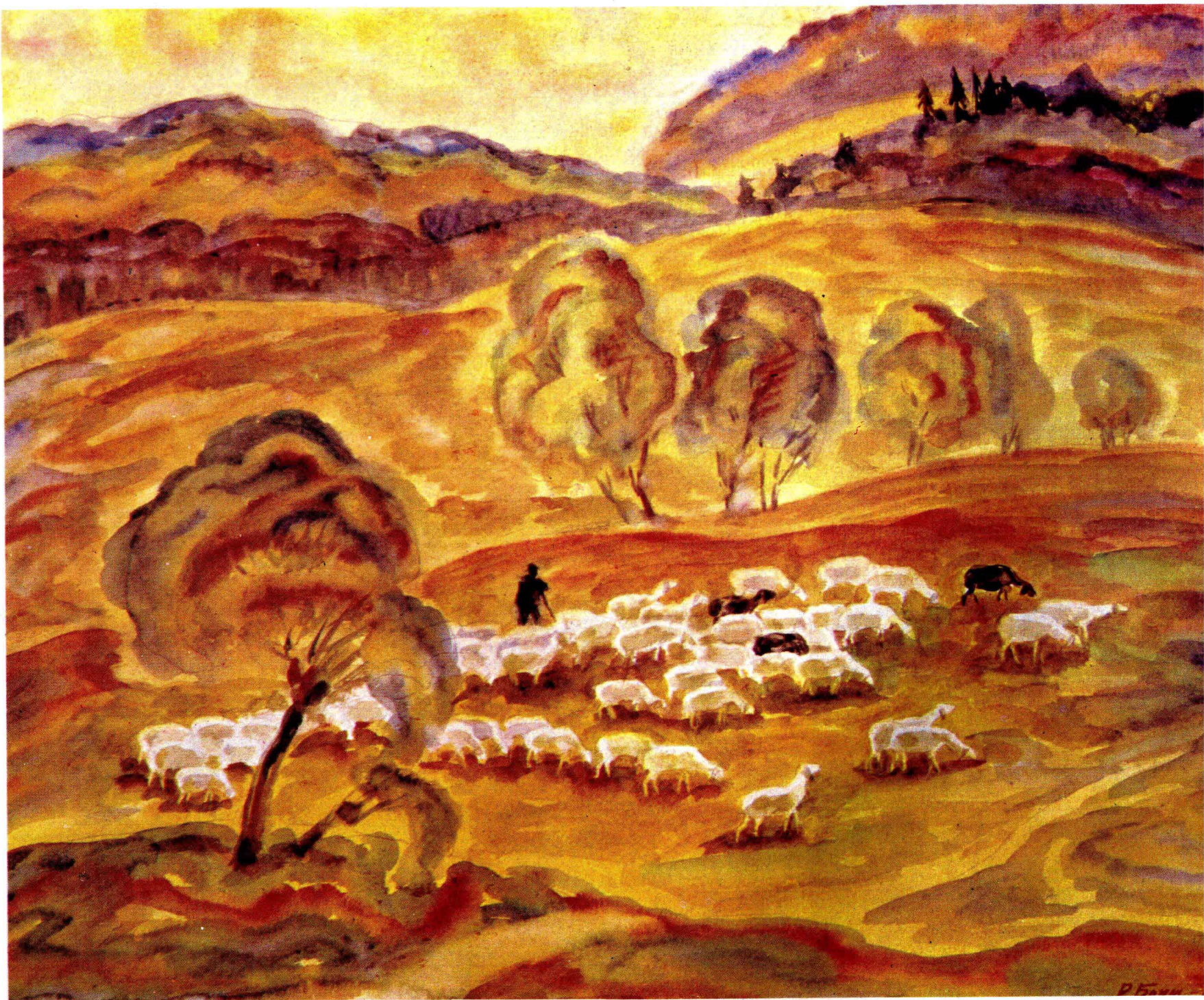
8 山地牧场——《在卡尔巴特》组画之一 1980—1981年 57×69cm P·C·鲍伊木