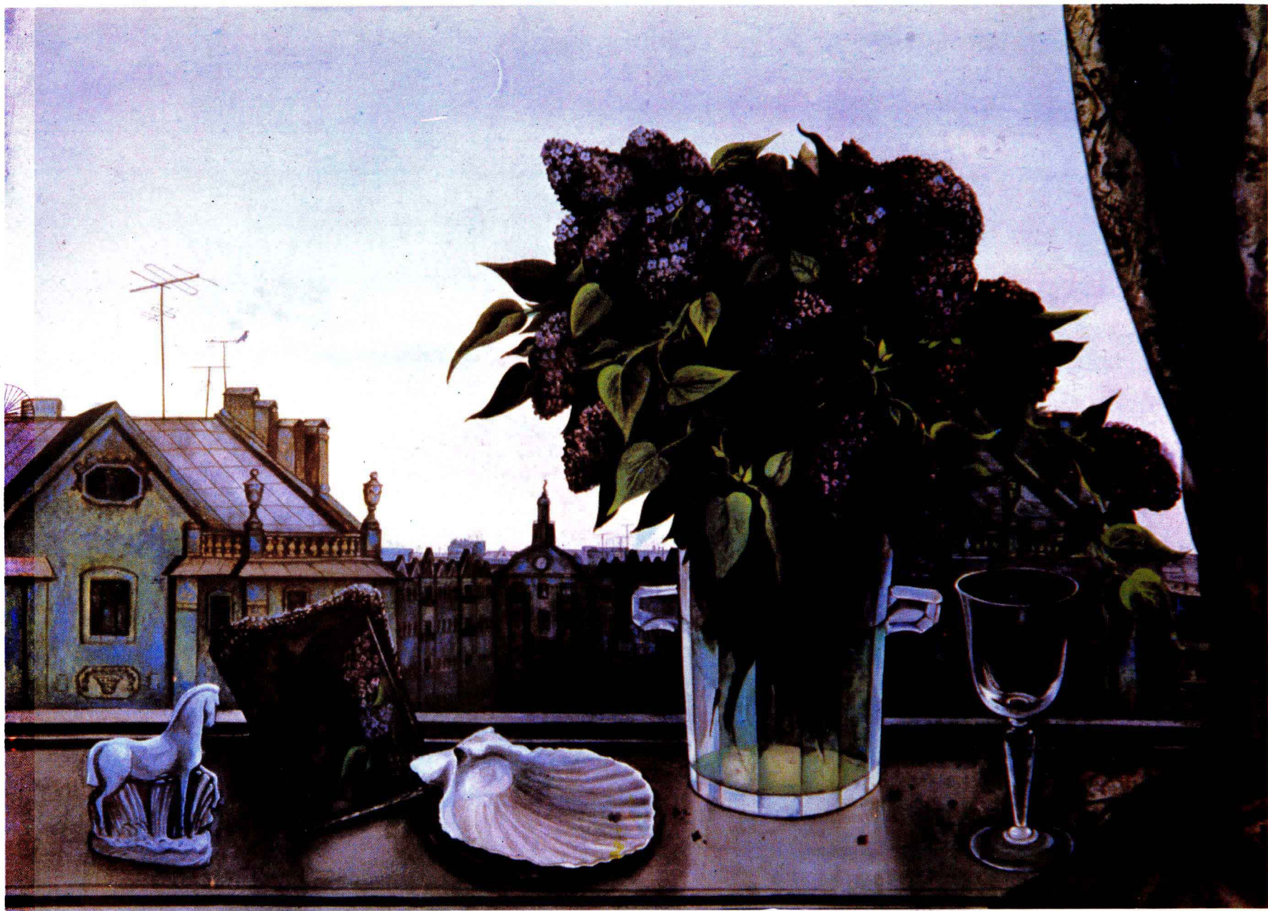
5 丁香花——《白夜》组画之一 1974年 55×71.5cm Д·А·别卡良