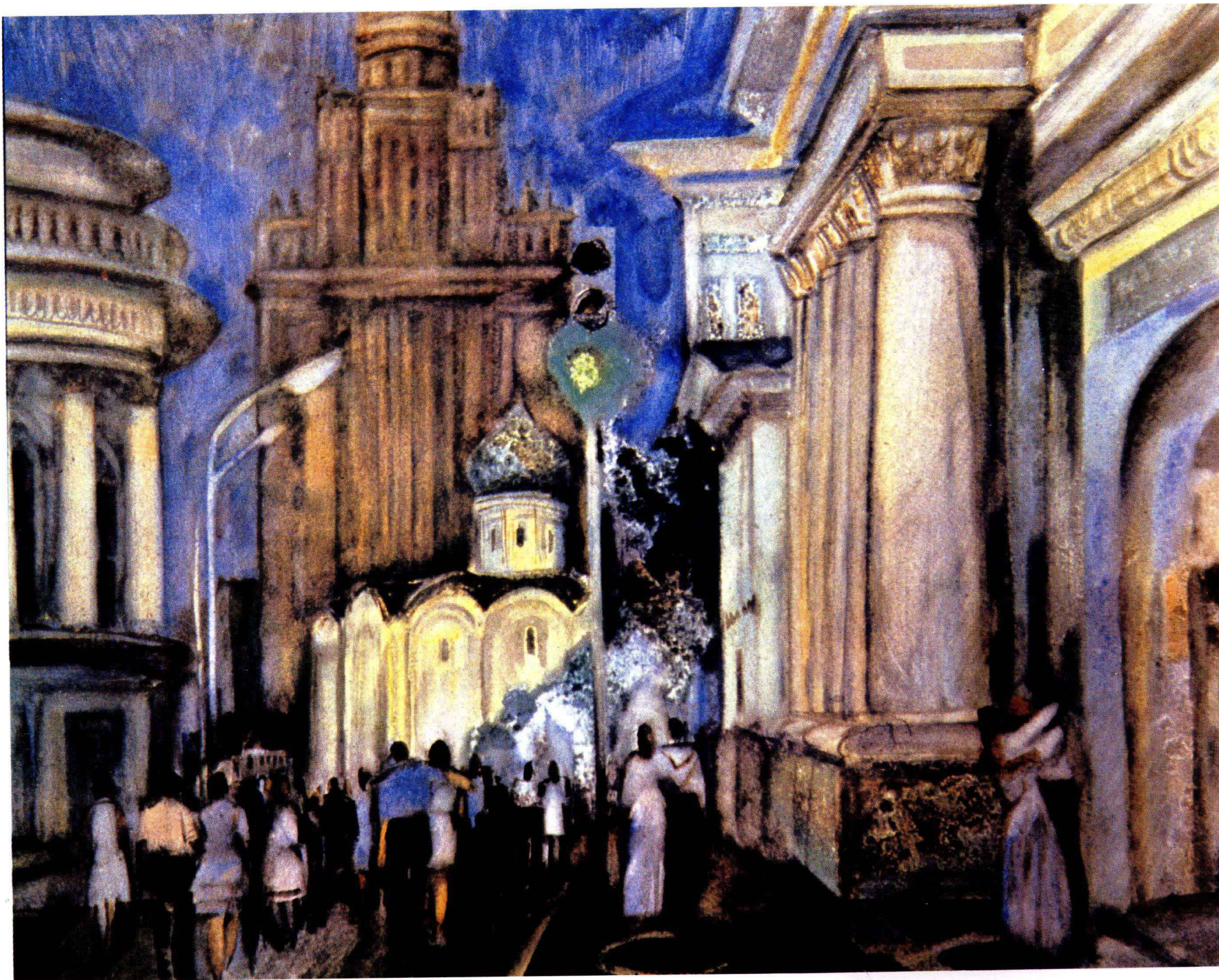
6 毕业的夜晚——《莫斯科》组画之一 1976年 57 × 69 cm H·Φ·别列日诺依