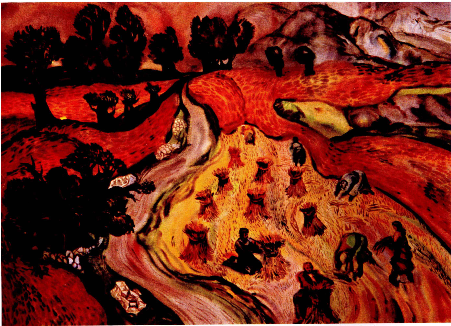
3 山地里的谷物 1971年 59 × 89 cm Ч·М·阿泽佐夫