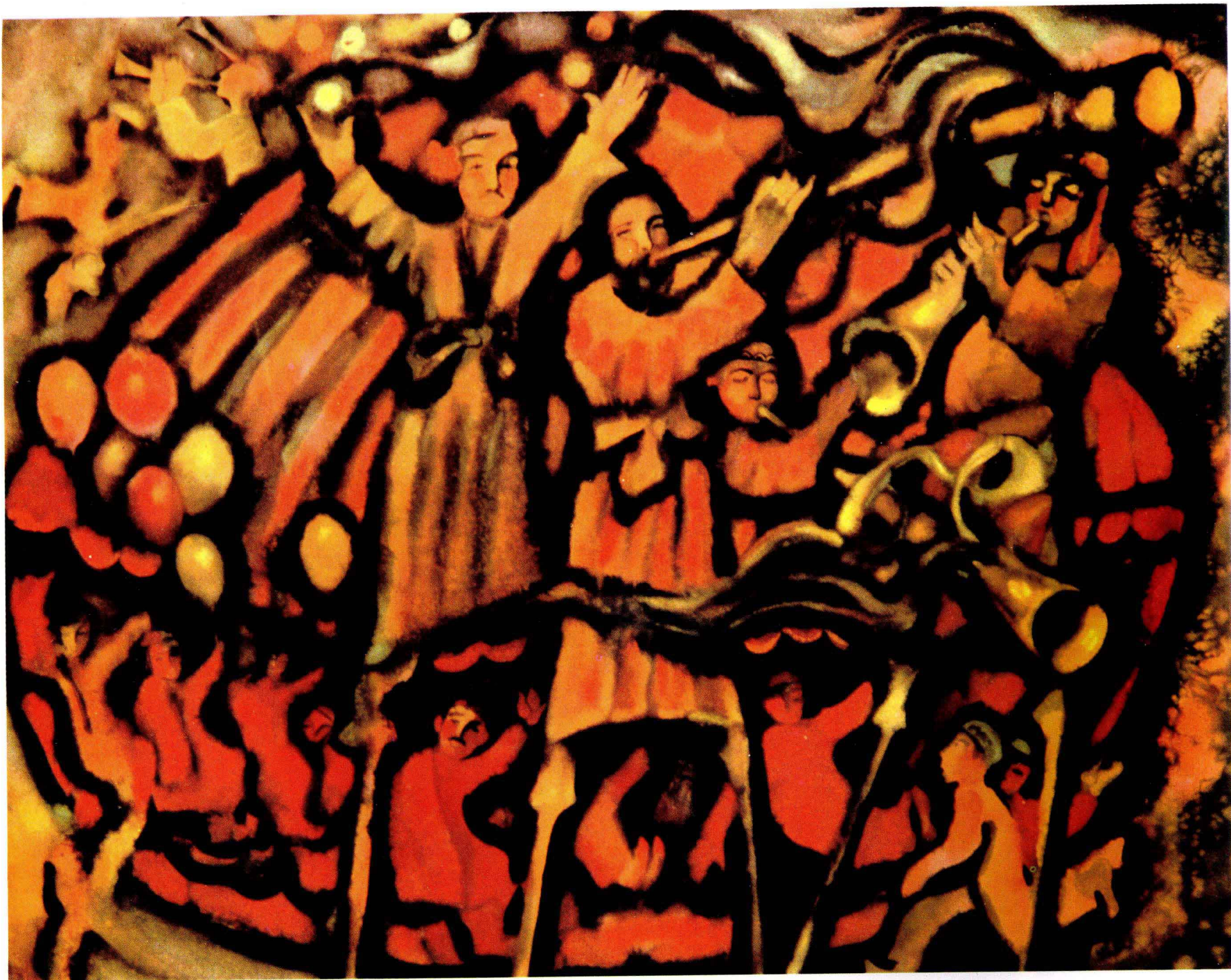
4 古城游艺园的旋转木马 1980年 72 × 92 cm Г·3·勃依玛朵夫