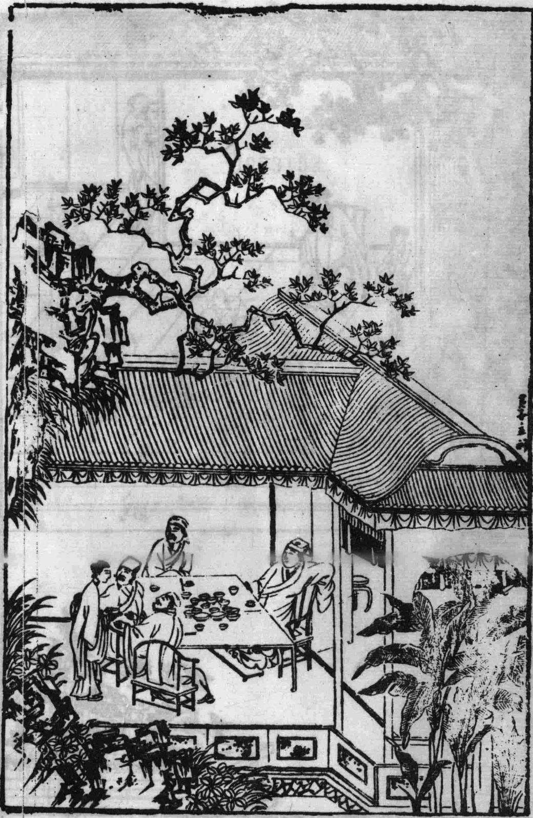
書童兒作女粧媚客