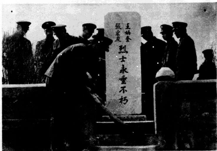
装甲兵学院教练团装甲一连官兵在祭扫烈士墓