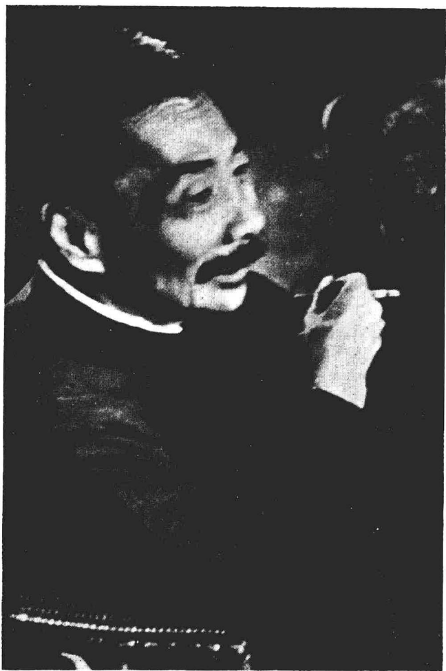
1936年摄于上海（最后遗照）