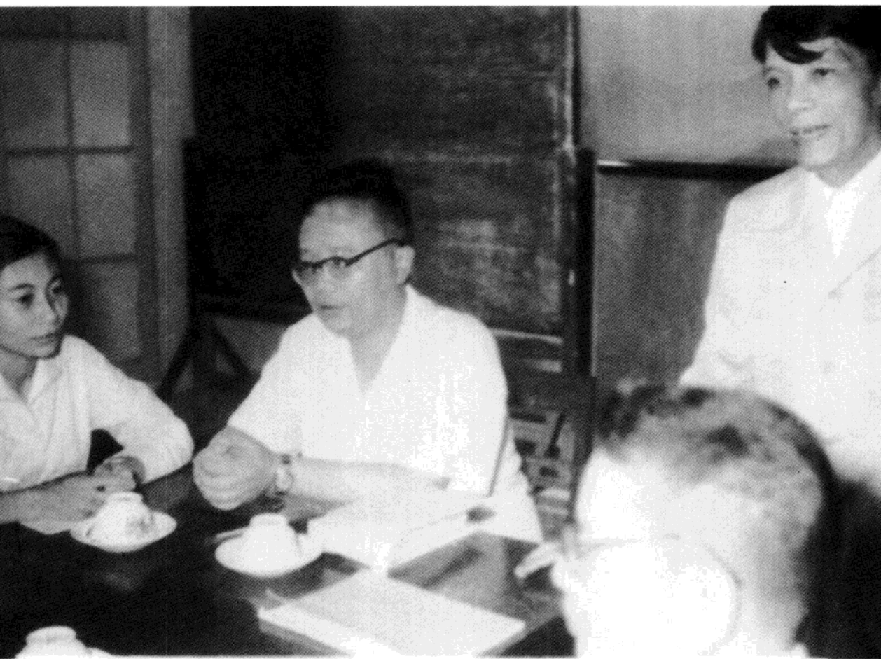
1961年，何其芳在越南河内访问。