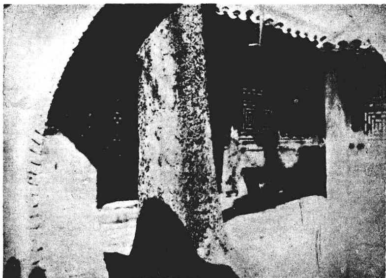
北京紹興縣館內的补树书屋。1912年5月魯迅住在館內 藤花館；1916年5月移住补树书屋到1919年11月。