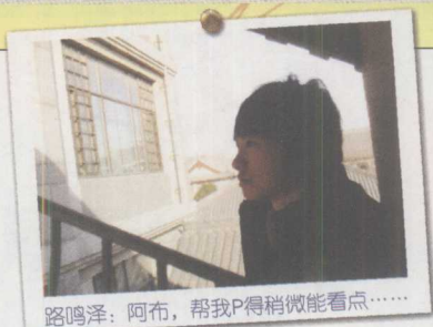
路鸣泽：阿布，帮我P得稍微能看点……

■ 江南：说起无双你跟我的差距好比顶空月和他老师的差距！若是对打的话我有把握让你