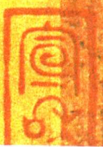
晋 陆机 平复帖