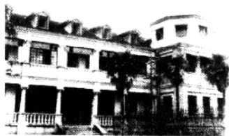
日伪南通特工机关——宋公馆