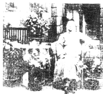
南通早期的共产党员吴亚普， 1939年牺牲于平江惨案。