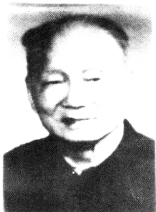
我国著名政治活动家李方