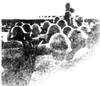
1938年3月17日日军饭塚部队在南通登陆