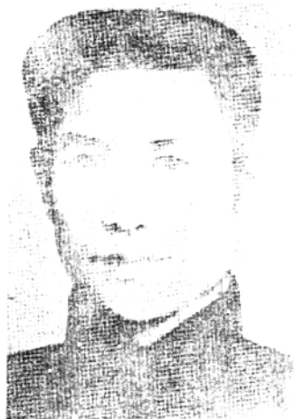
红十四军政委李超时， 1931年牺牲于镇江北固山。