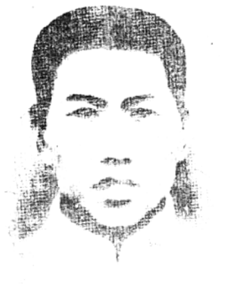
红十四军军长何坤， 1930年4月在战斗中牺牲。