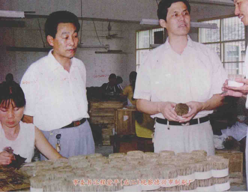
市委书记程爱平(右二)视察德兴市制刷厂