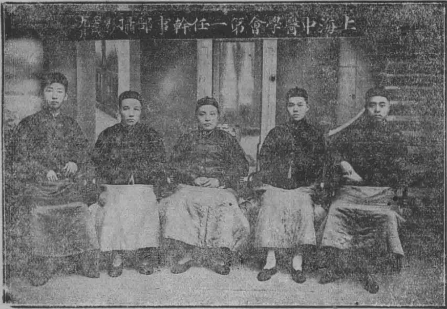
上海中醫學會第一任幹事部攝