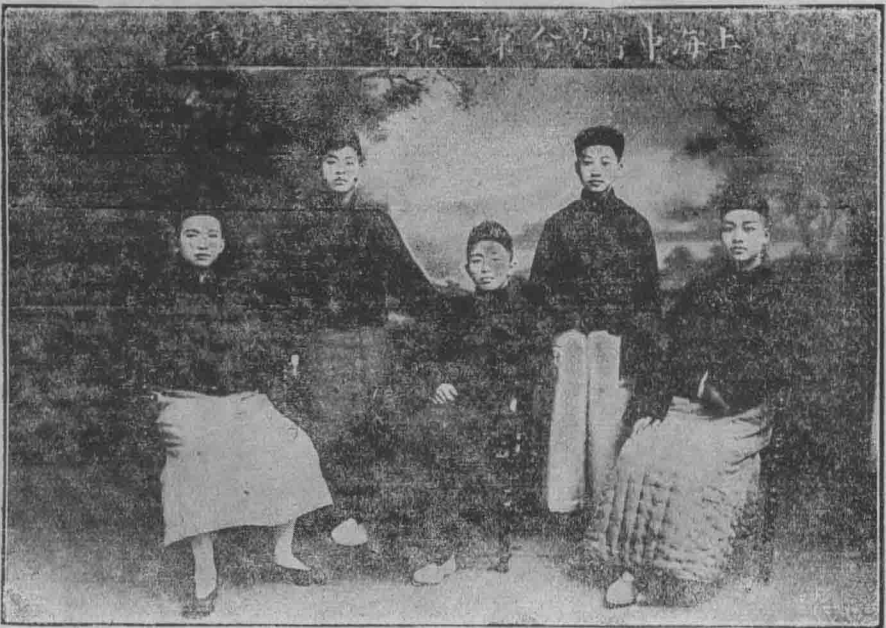
上海中醫學會第一任幹事部攝