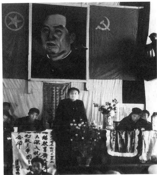
解放初期在淮陽地區共青團大會上做動員報告