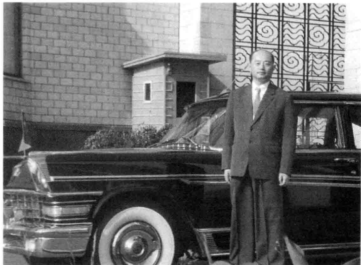
中国驻苏联使馆 (1960~1967年)