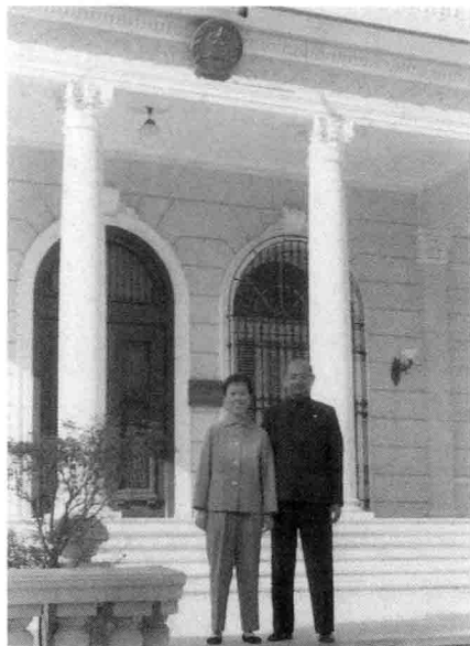
中国驻古巴大使馆 (1970~1975年)