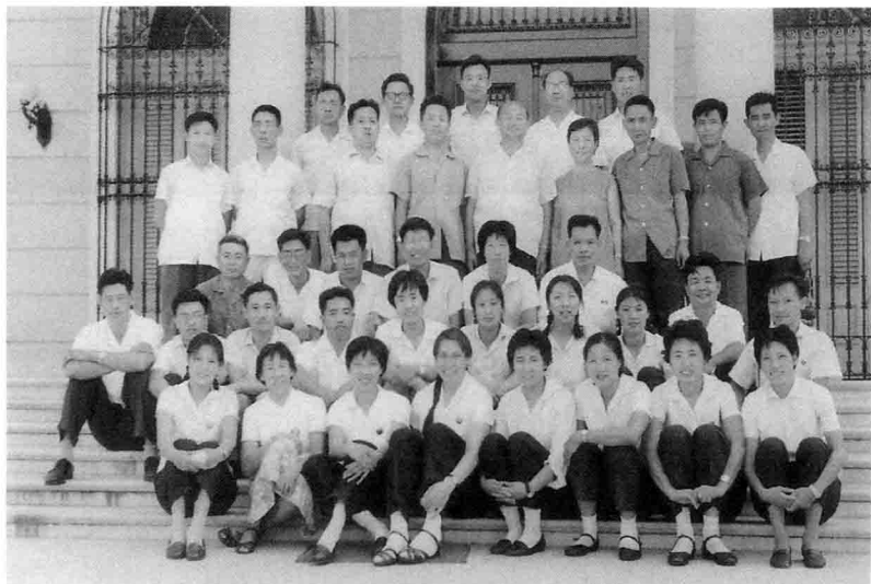
与访问古巴的中国女篮队员合影