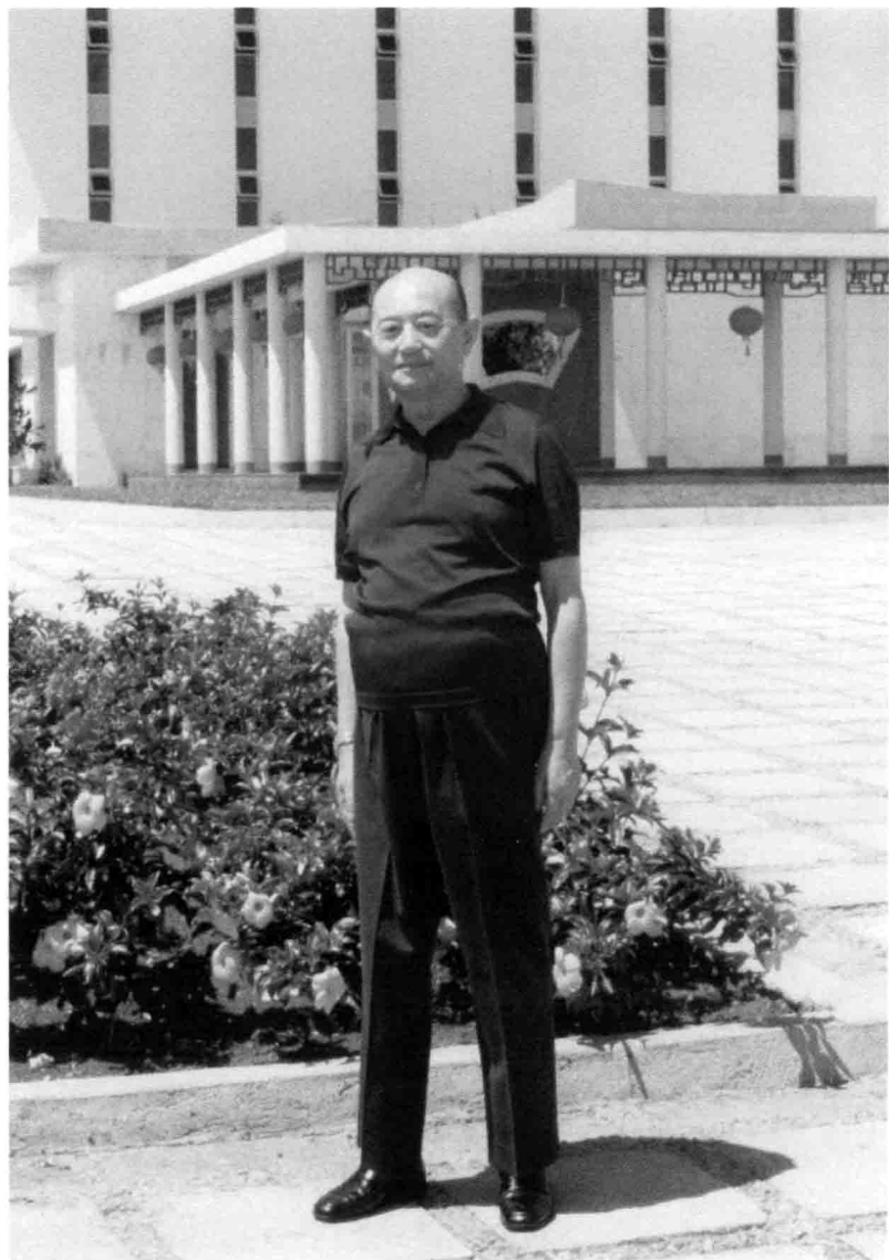
作者在驻巴西大使馆