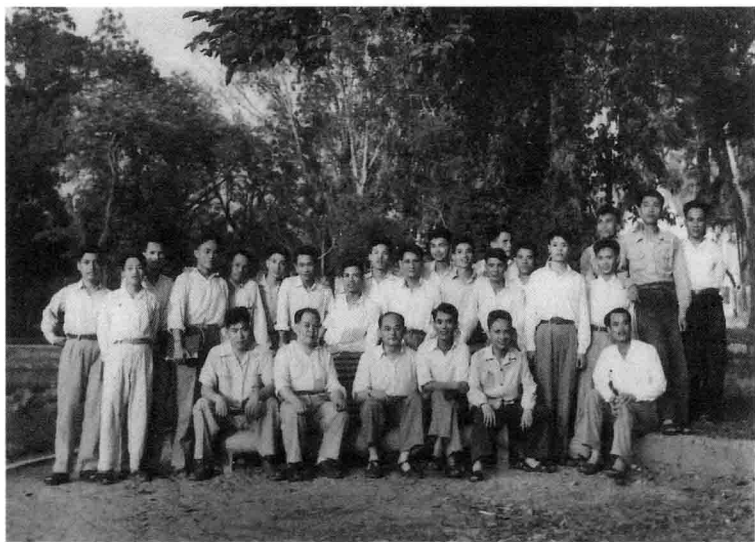
越南百草公园 (1955年, 前排中)