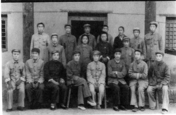
淮陽專區農協會(1950年，前排左三)