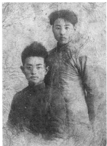
开封中国中学（1933年，左）