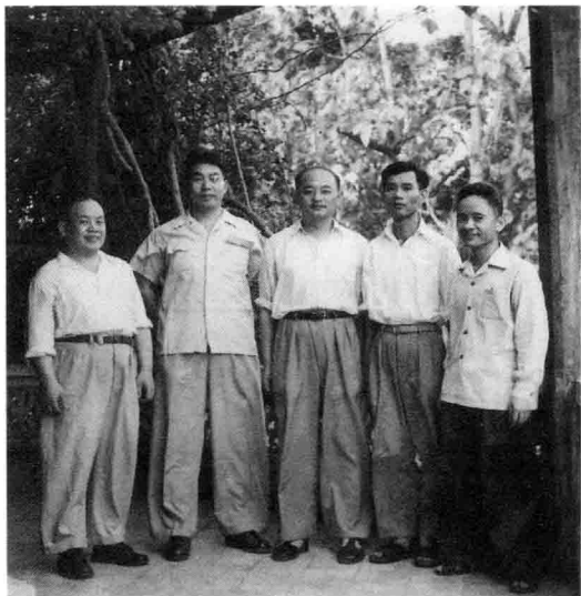
越南组织部大楼上 (1955, 中)