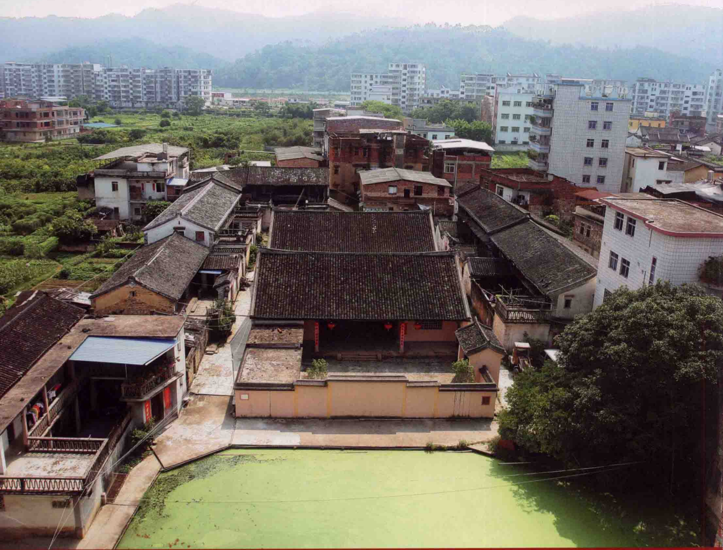
《长发堂》祖祠全景，位于湖寮镇新村塘卜里东北向，大门侧开，座北朝南向帽山峰。