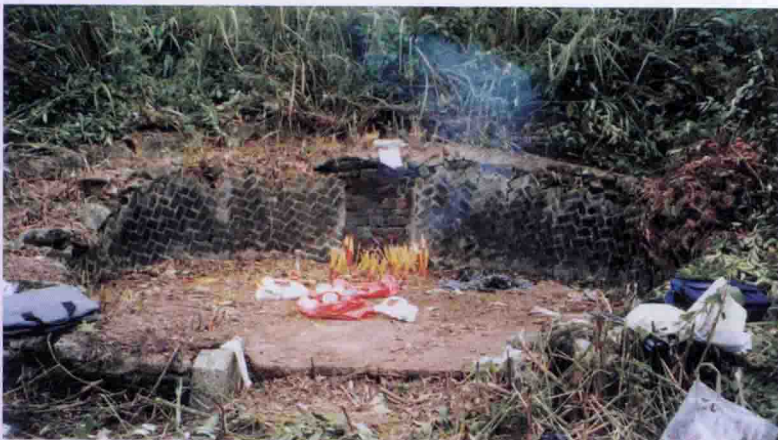
◀ 13世祖子敬公墓 “黄牛归栏”