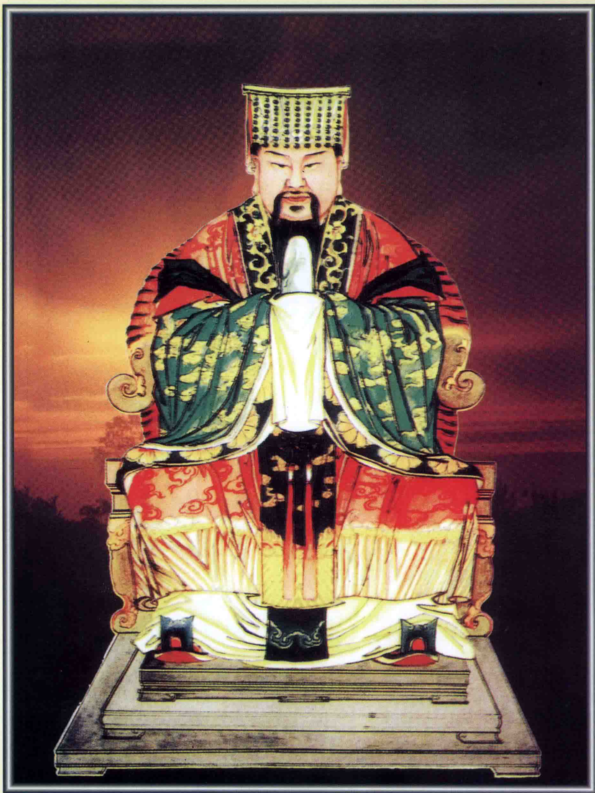
▲ 传代始祖仲雍仪像