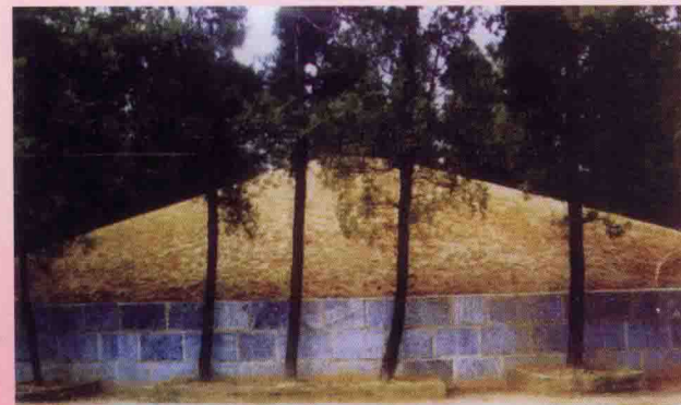
▲ 河南南阳市东汉大司马广平侯吴汉墓