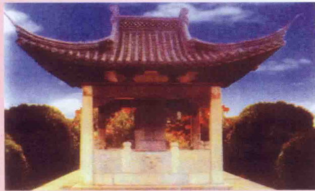
▲ 江苏丹阳季札十字碑亭