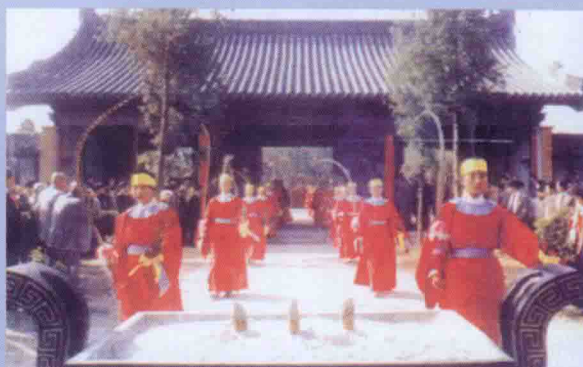
▲ 一九九一年祭祖大典盛况