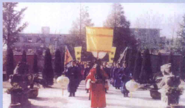
▲ 一九九一年祭祖大典仪仗队