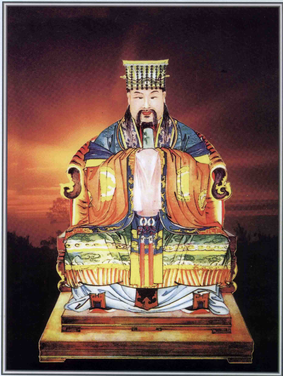
▲ 开姓始祖泰伯仪像