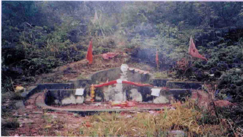
◀ 12世祖三思公墓 “凤山形”