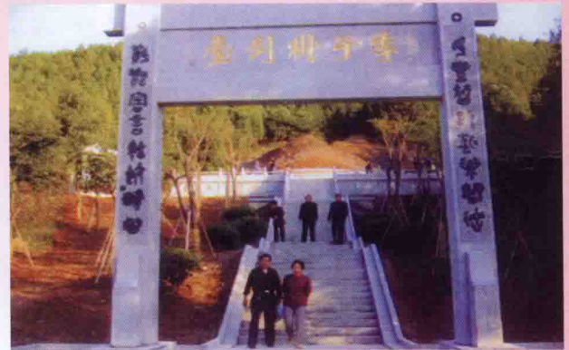
▲ 江苏徐州季子挂剑台