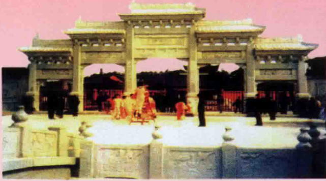
▲ “第一世家”青石大牌坊