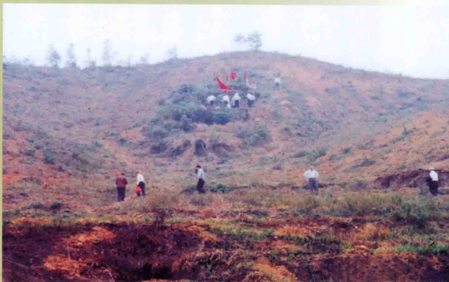
◀ 11世光集公淑配云氏墓 “燕子归巢”