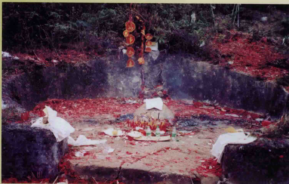
▶ 11世光集公淑配云氏 墓穴