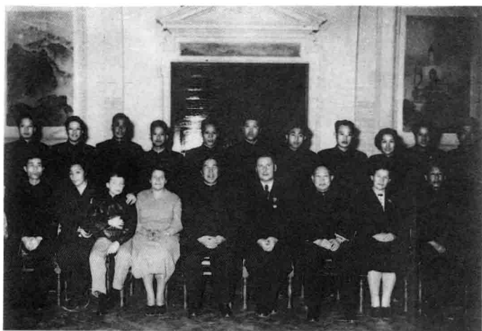
佟铮同志(后右六)与市领导刘仁(前右三)、郑天翔(前左一)张友渔同志、苏联专家阿·谢·勃得列夫、安·安·尤尼娜合影 (1957年于北京市都市规划委员会)