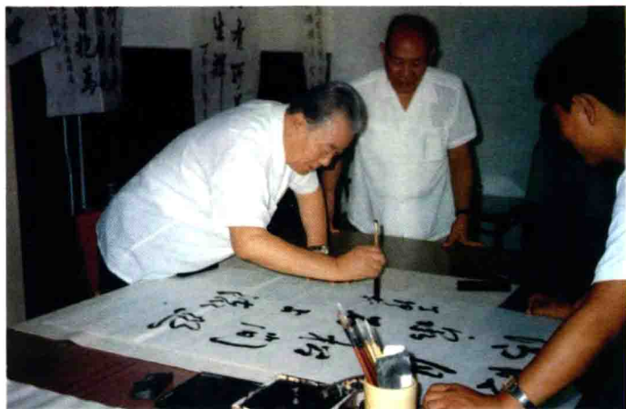
佟铮同志为市委顾委活动站题词(1987年8月)