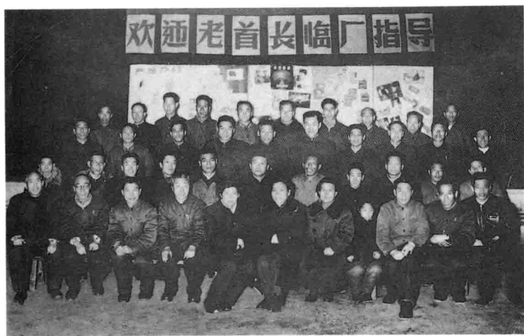
1960年春节晋察冀军区印刷局老战士聚会在解放军画报社印刷厂