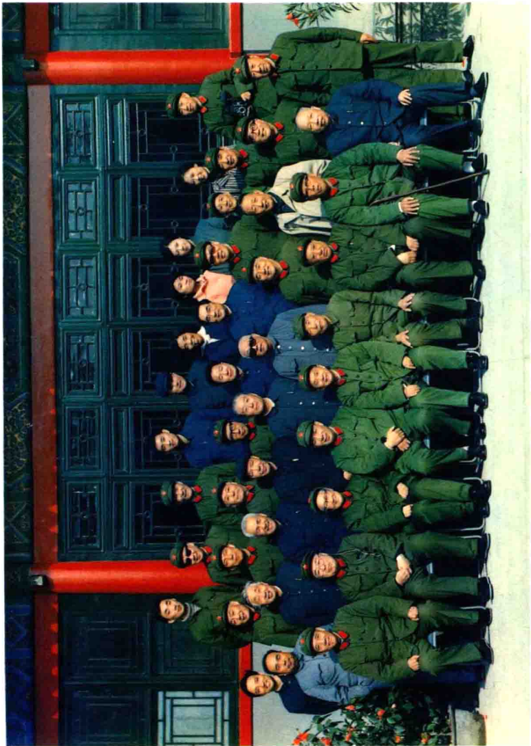
1988年春天晋察冀军区政治部老战友合影