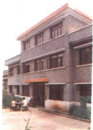
中 枢 镇 社 会 福 利 院