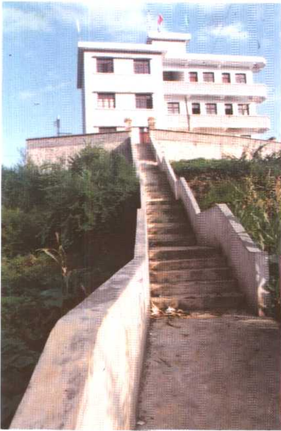
中枢镇自来水处理车间