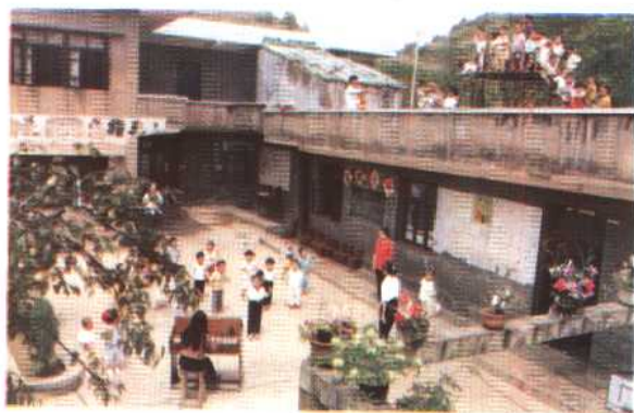
中 枢 镇 辖 幼 儿 园