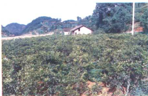
中枢镇杨堡坝柑桔林