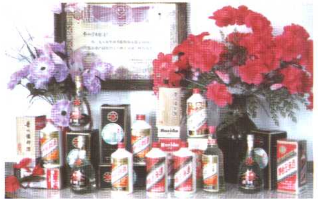
中枢镇台醇酒厂系列产品