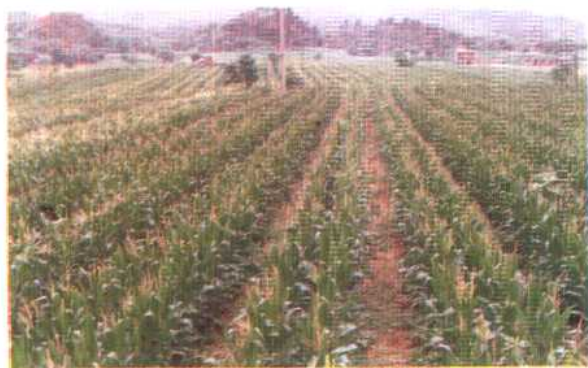
中枢镇旱地分带轮作多熟制