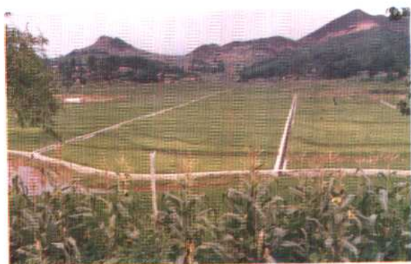
中枢镇水塘冷改工程