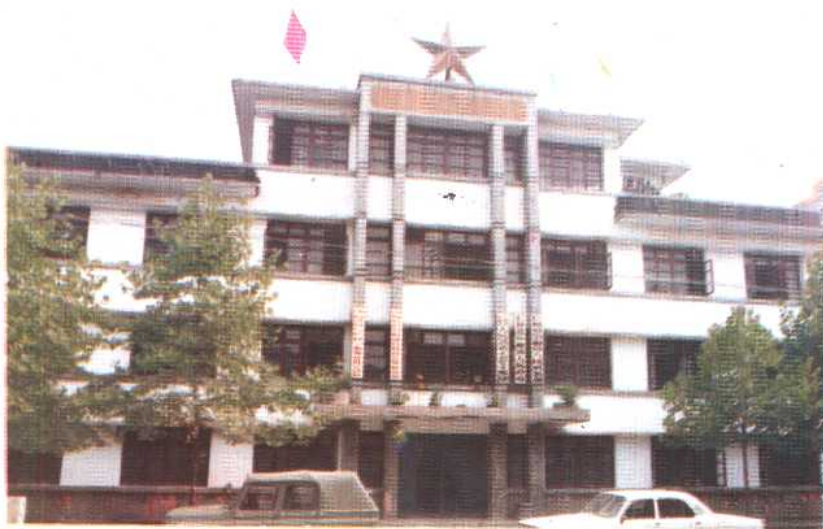
中 枢 镇 办 公 大 楼