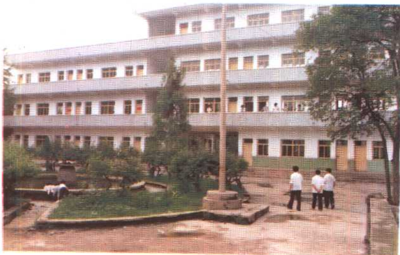
中 枢 镇 第 一 小 学